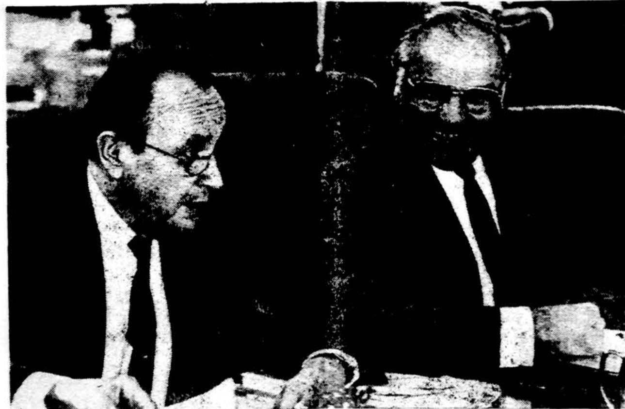
Vakarų Vokietijos kancleris Helmut Kohl (dešinėje) ir užsienio reikalų ministeris Hans-Dietrich Genscher paskelbė Bonoje, jog Vokietijos institutams ir biznio bendrovėms bus leista įsijungti į erdvės ginklų tyrinėjimus. Sausio mėn. prasidės derybos su JAV vyriausybe.

— Filipinuose nuskendo keltavas laivas, žuvo 197 žmonės.