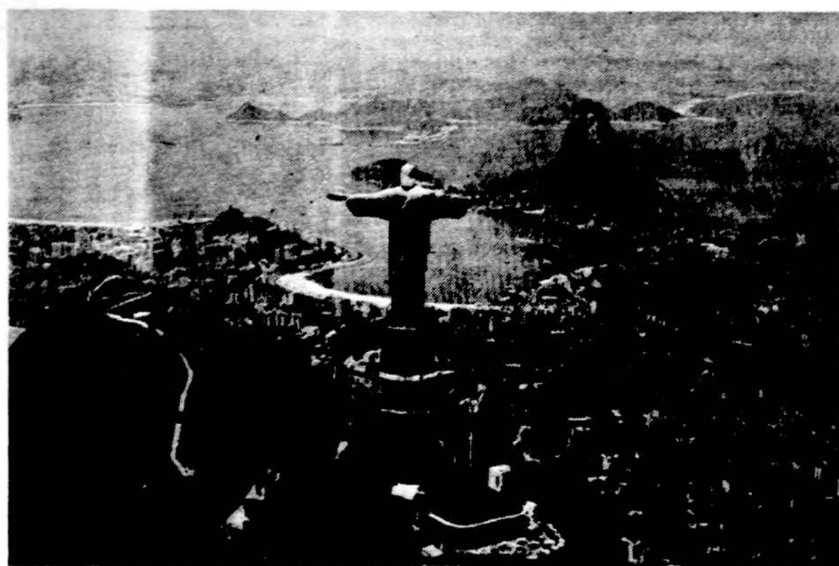
Reginys iš oro — Kristus Isganytojas, Parque Nacional da Tijuca, Rio de Janeiro, Brazilija.

Graikų filosofas Platonas yra pasakęs, kad gamta — laukai, pievos, miškai jam nieko nesako apie žmones, bet miestas daug ką pasako apie jo gyventojus. Pamačius Rio de Janeiro, su septyniais milijonais gyventojų, susidarė labai geras jų kasdieninio gyvenimo vaizdas. Reikia pačiam aplankyti kraštą, kad galėtum susidaryti tikslesnį jo vaizdą. Tikta pamacius, jis pasidarė realus, nebe toks romantiškas, nebe toks gražus kaip turistinėse reklamose. Dažnai pasitaiko, kad pačiam patyrus krašto ar miesto gyventojų papročius, elgesį, temperamentą, pasikeičia nuomonė apie jį, kartais į geresnę pusę, kartais į prastesnę. Rio de Janeiro pasiliks atmintyje, kaip gražus miestas iš tolo, apsuptas žavia gamta, bet pamacius jį iš arčiau, jis pasirodo komplikuoatas ir pilnas kontrastų miestas. Vienus miestus aplankius, norisi juose pasilikti ir gyventi. Rio de Janeiro yra vienas iš tokių miestų, kurį džiaugiuos pamaciusi ir nebuvo jau taip labai liūdna jį apleidžiant.