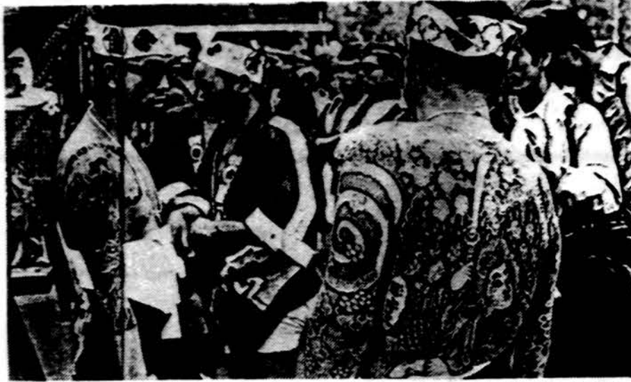
Pvz. 1. Japonai tatuiravimosi parodoje: žmonės pasididžiūdami rodo dažnai didžią dalį kūno apimančius brėžinius.

ragauti „poniškos“ daržovės ir pamėgę pradėjo patys bulvių auginti.