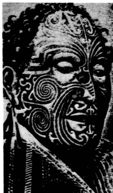
Pvz. 3. Naujosios Zelandijos vyras išsitatuiravęs veidą spiralėmis. Anksčiau ten taip dažydavosi vyrai kareiviams eidami.

Panašiai nutiko kitu reikalu Vokietijoje, Bavarijoje. Jos karalius pradėjo nešioti trumpas odines kelnes, tada visi bavarai mušte mušėsi prie tokių kelnų. Ne kitaip buvo ir su bulvėmis, kurių pradžioje šiaip žmonės nemėgo. Tik kai dvaruose jos būdavo auginamos ir kai rudenį darbininkai išmesdavo kelias jų per aukštą dvaro tvorą, tada iš smalsumo ėmė ūkininkai