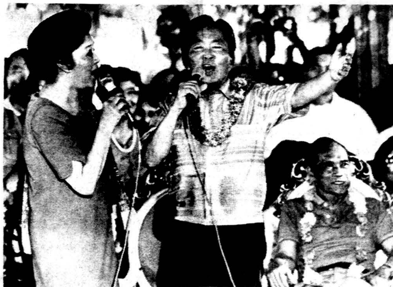
Filipinų rinkimų kampanijoje prezidentas Marcos ir jo žmona Imelda užtraukė liaudies dainą. Dešinėje sėdi kandidatas į viceprezidento vietą Arturo Tolentino. Rinkimai bus vasario 7 d. Filipinų komunistų partija paskelbė įsakymą rinkimus boikotuoti.

— Indijoje Amritsaro mieste policija susišaudė su sikhų radikalais. Trys žmonės sužeisti, radikalai pabėgo. Praėjusią savaitę žuvo trys žmonės.