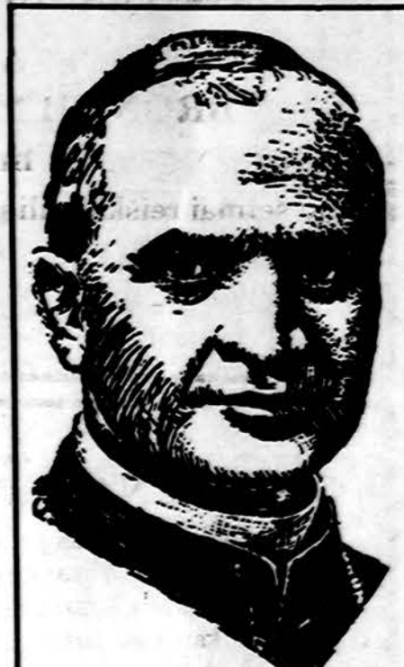
DRAUGO akaitojai yra kviečiami prisidėti prie šių Mišių.