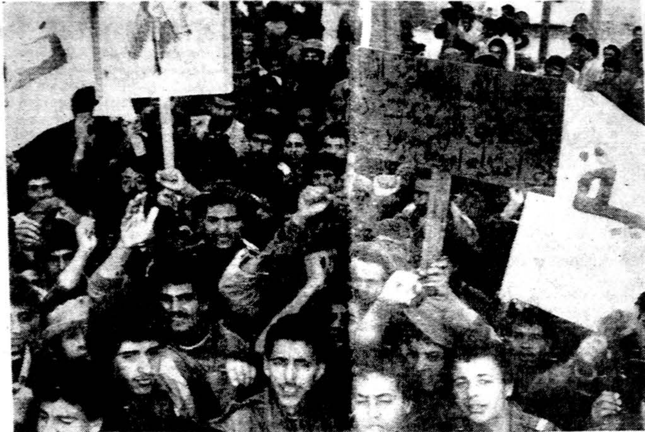
Libijoje vyksta piktos demonstracijos prieš Ameriką ir „sionistus“. Transparentai išreiškia „revoliucijos vadui“ pulk. Muammarui Khaddafiui paramą ir pasitikėjimą.

Užsienio spaudos dėmesį neseniai atkreipė naujas Maskvos raginimas Lietuvos komunistų partijai veiksmingiau vykdyti Lietuvoje antireliginę propagandą. Reuterio žinių agentūra, remdama maskviškės „Pravdos“ pranešimu, informuoja, kad antireliginės propagandos stiprinimo Lietuvoje klausimą Vilniuje posėdžiavusiai Lietuvos komunistų partijos vadovybei išklė sovietų komunistų partijos ideologas Borisas Ponomariovas. Jis pabrėžė, jog turi būti imamasi veiksmingesnių priemonių darbo žmonių tarpe formuojant komunistinę pasaulėžiūrą, siekiant apsaugoti Lietuvos visuomenę nuo komunizmui priešiškos ideologijos įtakos. Ponomariovas įspėjo, jog ateistinė veikla Lietuvoje nėra pakankama, ji turi būti sustiprinta. Užsienio spauda, pateikdama šią informaciją, atkreipia dėmesį, kad Lietuva yra katalikiškas kraštas ir kad smarkų lietuvių religingumą bei tautinį sąmoningumą stiprina kaimynystė su Lenkija.