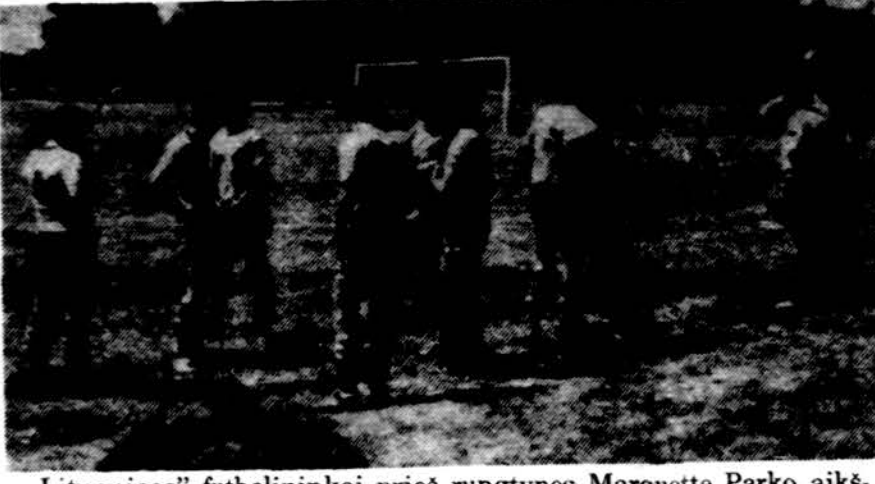
„Lituanicos“ futbolininkai prieš rungtynes Marquette Parko aikštėje.

sachmatų, rankinio, lauko teniso, slidinėjimo varžybas ir kiek platesnis aprašymas golfo pirmenybių, vykusių darbo dienos savaitgalyje Wyndwicko, St. Joseph, Mich. Apie šaudymo varžybas rašo B. Savickas. Trumpai paminėtos lengvosios atletikos pirmenybės Miltone, o taip pat pabaltiečių ir lietuvių plaukimo pirmenybės. Pr. Bernecko straipsnis „Opui reikalu“ ir ištrauka „Sporto apžvalgoje“ spausdinto Pr. Mickevičiaus pasikalbėjimo su Pr. Bernecku. „Is CV posėdžių“ — leidžia žvilgtelti į ŠALFASS-gos centro valdybos veiklą, rūpestius ir nutarimus. Net keturi puslapiai skiriami labai reikalingai informacijai — ŠALFASS-gos centro valdybos ir kitų jos organų narių, sporto klubų vadovų ir kitų darbuotojų pavardės ir adresai. Supažindinama ir su lietuviškais laikraščiais turinčiais nuolatinius sporto skyrius bei jų redaktorius, o taip pat ir laikraščiais, rašančiais apie sportą. Baigiamieji straipsniai „Žodis taktininkams“ suminiami apie sportą rašantieji asmenys ir foto reporteriai — jiems dėkojama. Taigi, nors nedidelis apimtimi, bet turtingas ir įdomus turiniu. Sveikiname atgimusį „Žodį“, jo leidėją ŠALFASS-gos CV ir redaktorių. Tikimės, kad jį džiaugsmingai sveiks ir rėms visi lietuvių sportininkai, sporto darbuotojai ir lietuviškoji sportu besidominti visuomenė. Linkime redaktoriumi sėkmės ir išvėmės, o „Žodžiui“ gausių bendradarbių ir ilgo gyvavimo.