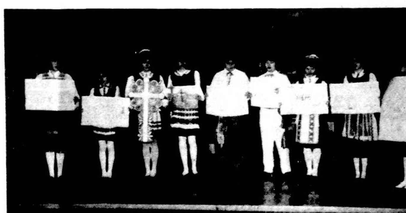
Būrelis septinto skyriaus mokinių atlieka programą Dariaus Girėno mokykloje.