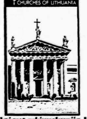
Vilniaus arkivyskupija I