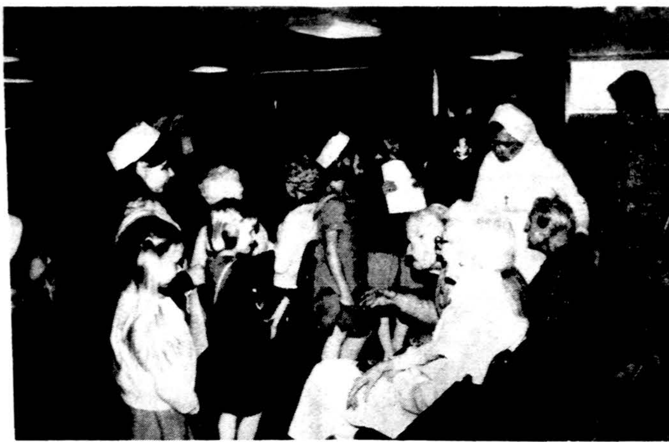
„Nerijos“ jūrų skautiū tunto „Nidos“ laivo sesės lanko senelius Šventos Šeimos viloje