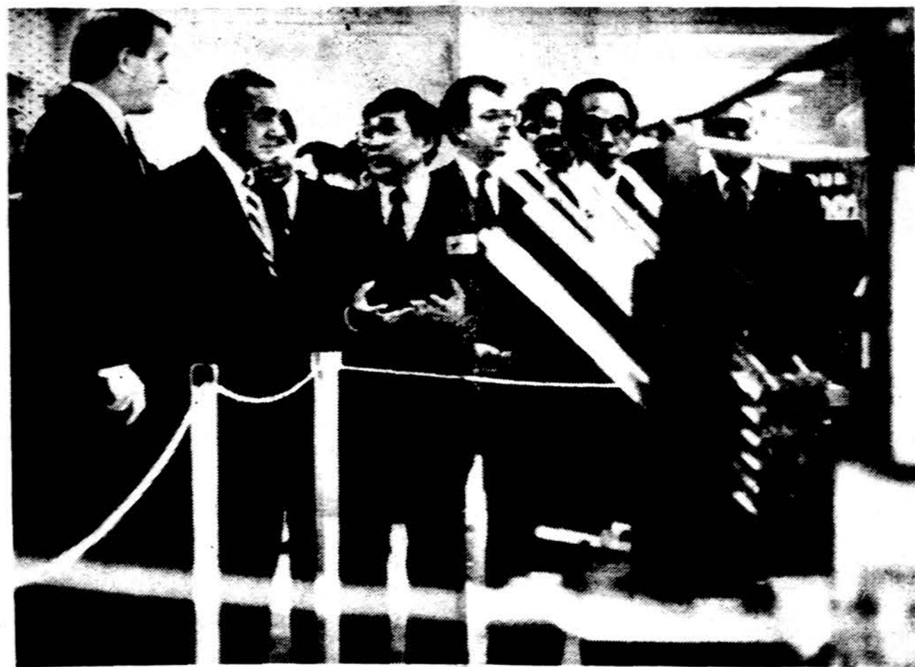
Kanados premjeras Brian Mulroney ir Japonijos premjeras Yasuhiro Nakasone apžiūri Toronte elektroninį imonę. Japonų premjeras viešės Kanadoje keturias dienas, bus svarstomi prekybos klausimai.

Pietų Jemenas, buvusi britų kolonija Adenas, 1967 m. tapo nepriklausomas po ilgą išsivadavimo kovą. Valstybė