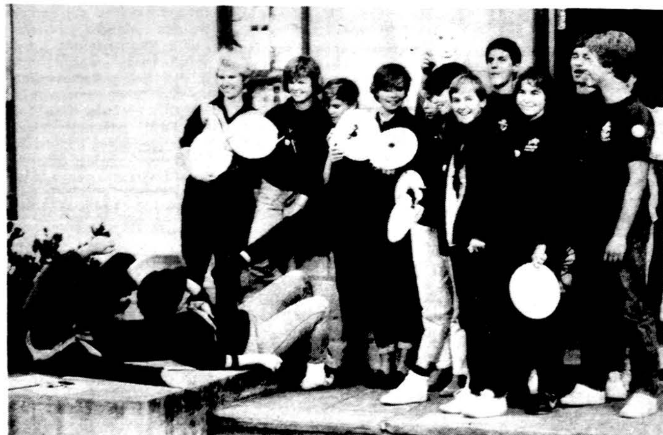
JAV Vidurio rajono draugininkų studijų dienos metu pasirodymui ruošiasi būrelis jaunesnių brolių ir sesių.