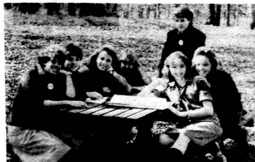
Draugininkų studijų dienos metu būrelis sesių, pertraukusios rimtas diskusijas, švęsosi broliui fotografui.

Prieš 3 metus, 1982 metais Pasaulio skautija šventė savo 75 metų sukaktį. Tai sukaktį paminėti 118 valstybių išleido 384 pašto ženklus, 63 pašto vokus, atvirutes ir blokus (miniature sheets). 1985 metais viso pasaulio skautės šventė savo 75 metų jubiliejų. Tą sukaktį atžymėti kai kurie kraštai išleido ar numatė išleisti pašto ženklus. Isle of Man paštas sausio 31 dieną išleido 5 ženklus apie skautes. Metų bėgyje išleido ir kiti kraštai, jų tarpe Australija balandžio 17 d. išleido specialų voką. UNO 1985 metus pavadino Tarptautiniais Jaunimo Metais — IYY (International Youth Year). Visa eilė valstybių paminės IYY pašto ženklais. Tų pašto ženklų motyvuose nemažai skautiškuoju temų.