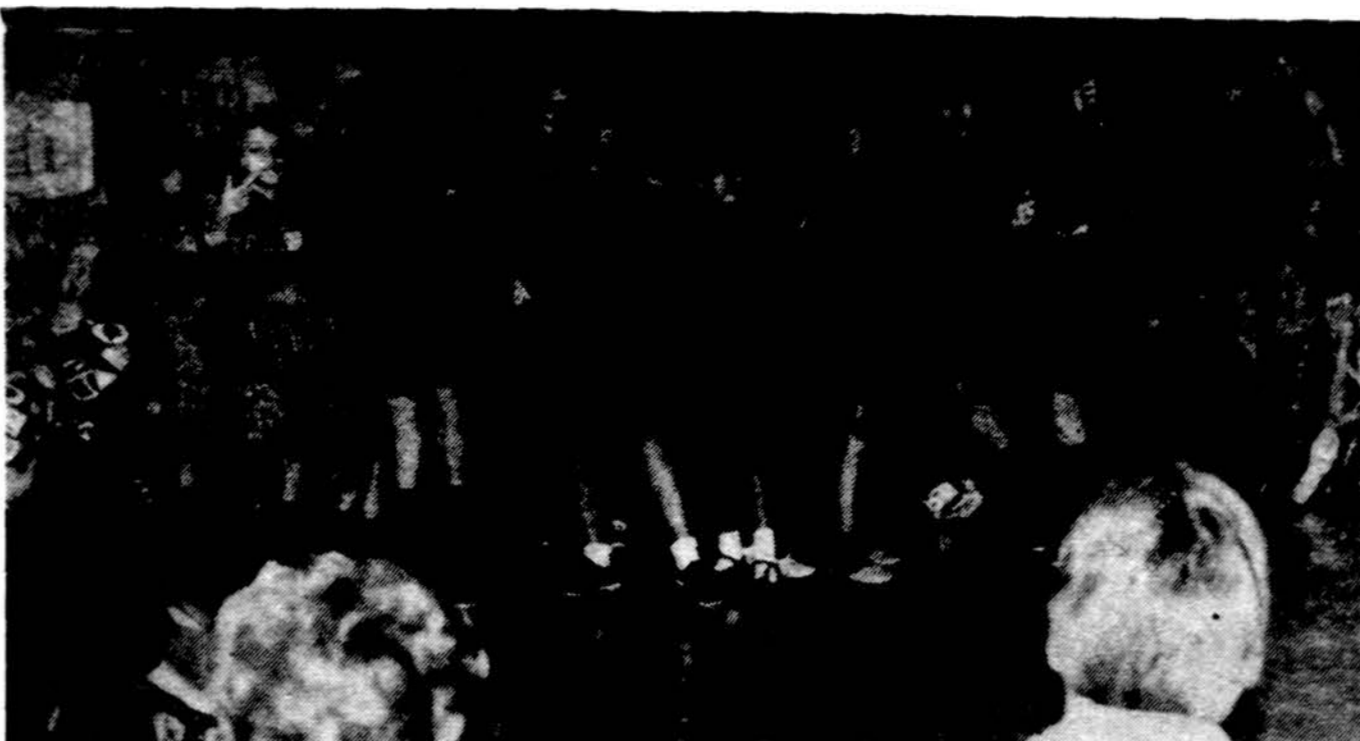
„Kernavės“ tunto sueigoje paukštytės „medžioja“ pelėdą.

1930 m. Studentų skautų, čiu d-ve išgyveno krizę. Dalis d-ės narių priklausė ir kitoms ideologinėms korporacijoms. Išleisus Skautų įstatymą (Skautų sąjungos