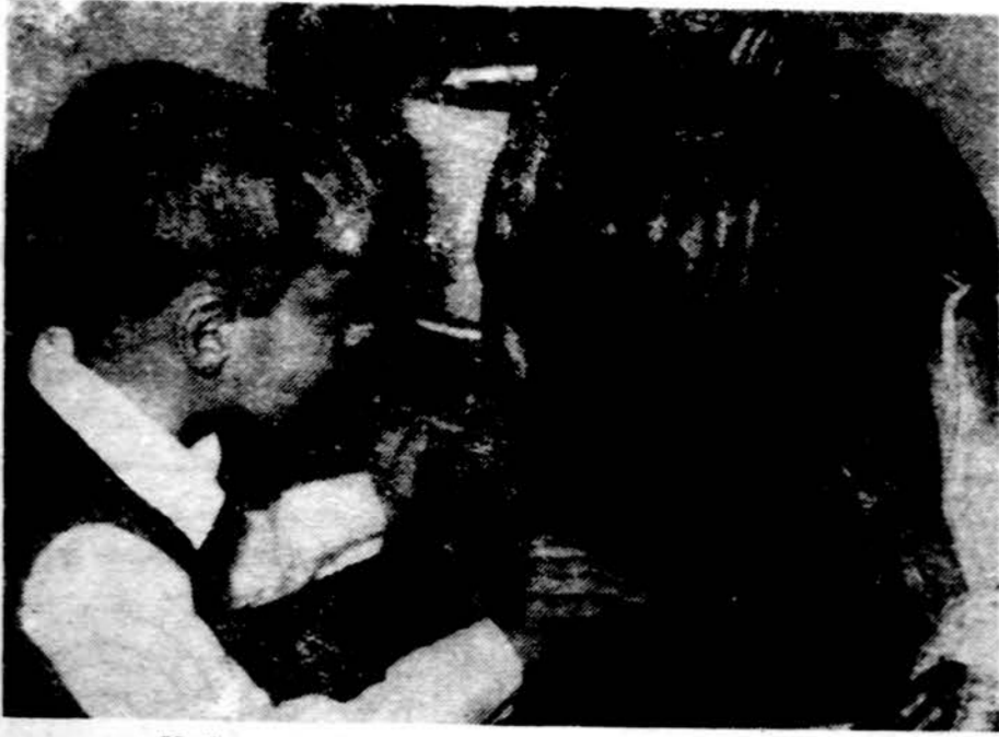
Vaikų namelių auklėtinis džiaugiasi moliūgu...