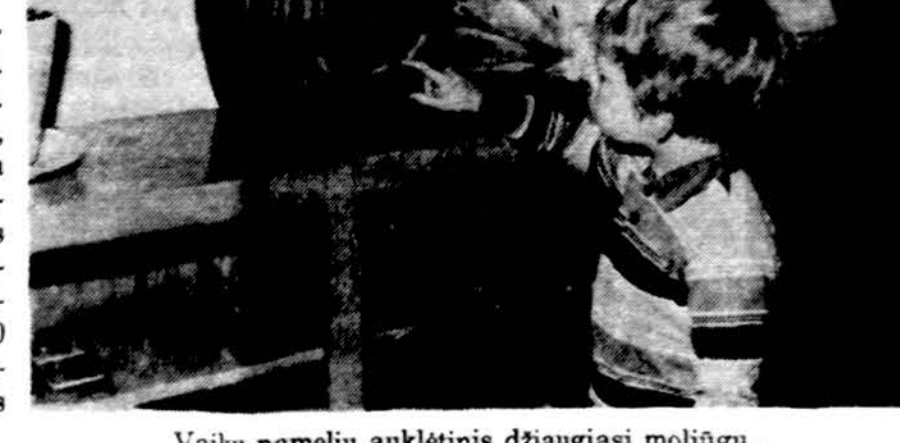
Vaikų namelių auklėtinis džiaugiasi moliūgu...