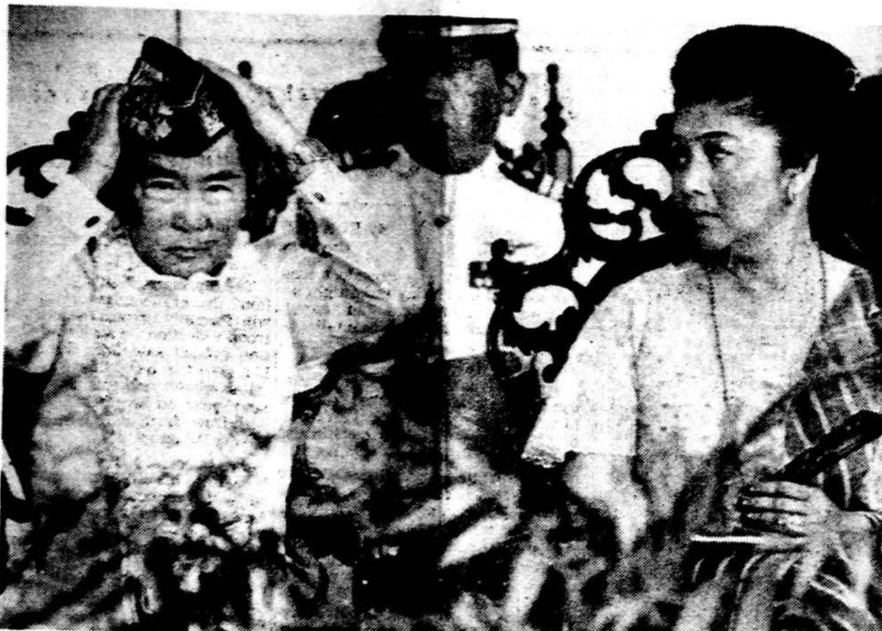
Filipinų prezidentas Ferdinand Marcos ir jo žmona Imelda rinkimų kampanijos įkarštyje. Vasario 7 d. rinkimai sudaro prezidentui daug rūpesčių, nes balsuotojai gerokai susirūpinę ekonominiiais šalies sunkumais, nedarbu ir žiniomis iš JAV, kur Kongreso pakomitetis paskelbė, kad prezidento žmona pirkė Amerikoje nekilojamo turto už 350 mil. dol.

— Belgijos policija suėmė keturis asmenis, du jų arabus. Surastas nemažas ginklų sandėlys.