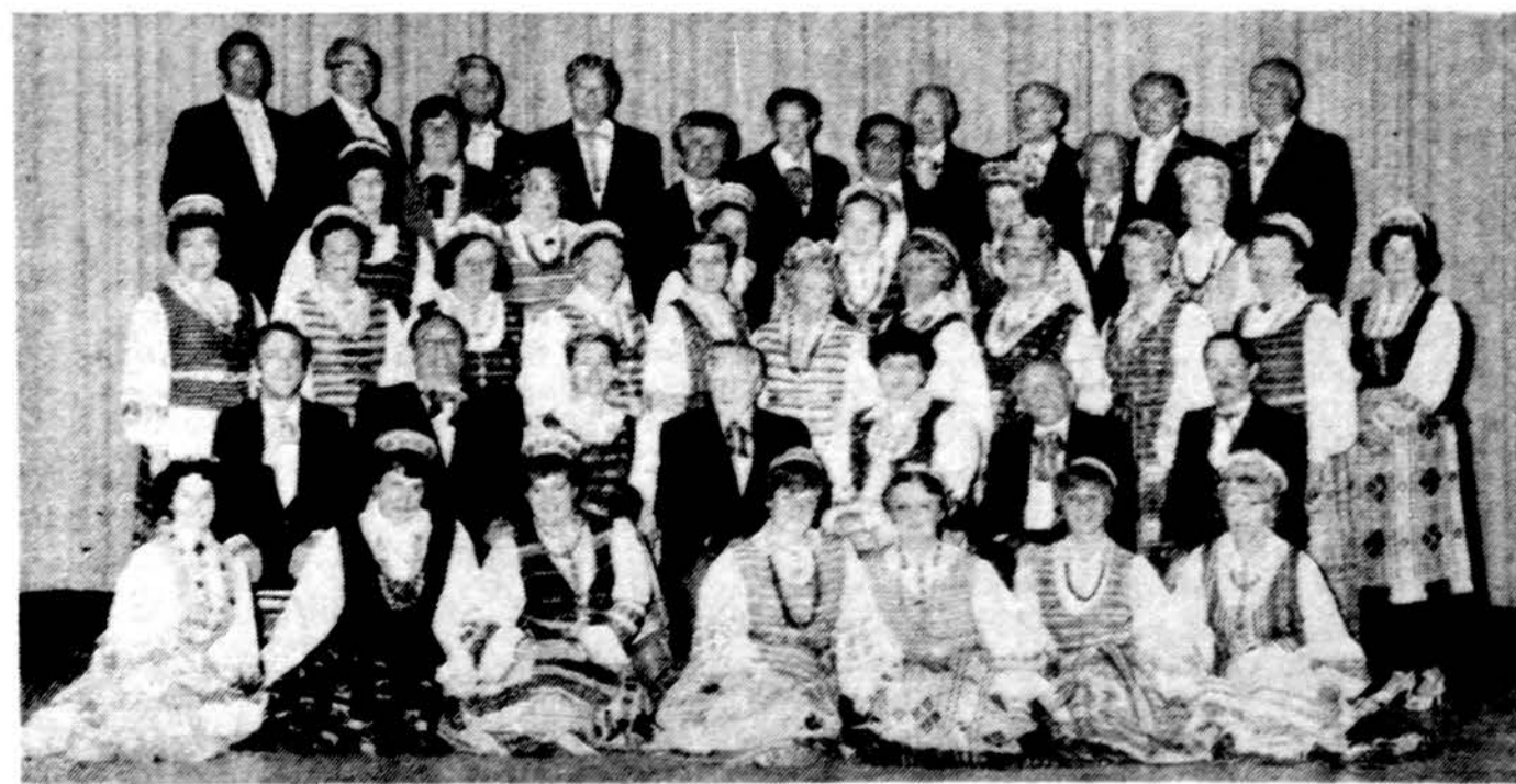
Dainavos ansamblis pereinai metais — 1985 m.

Užsakymus siųsti: DRAUGAS, 4545 W. 63rd St., Chicago, Ill. 60629