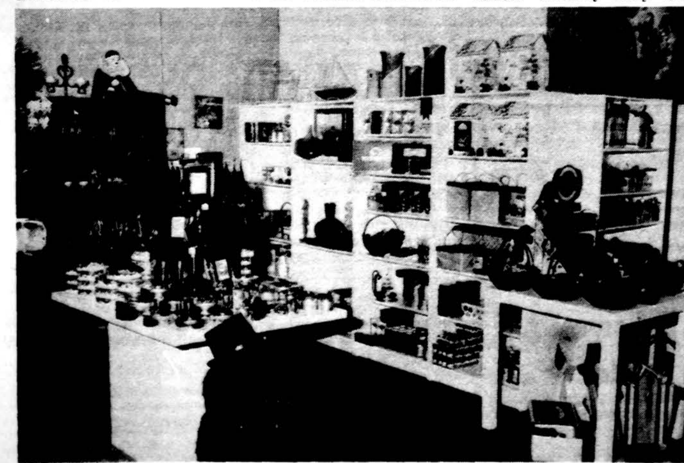
Kampelis Violetos Karosaitės „Lovable & Edible „Gifts“ parduotuvėje.