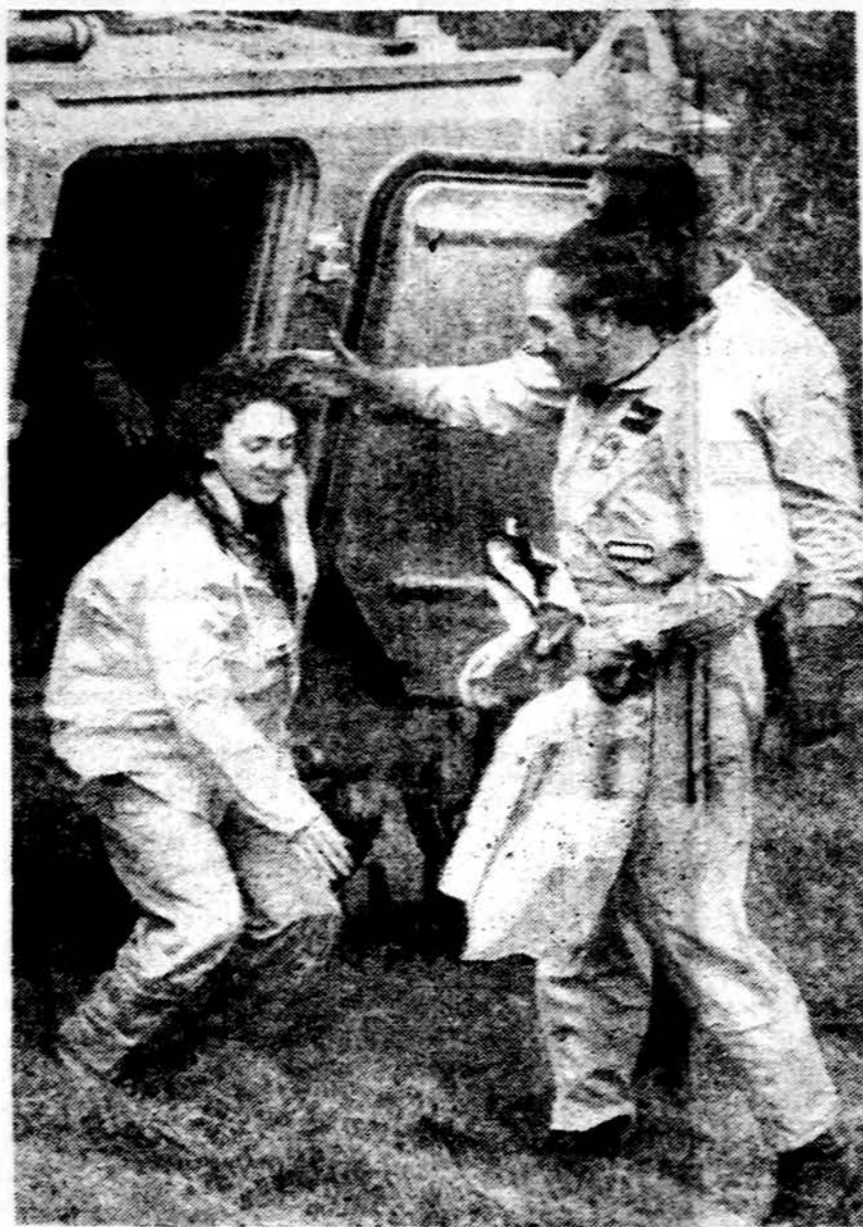
Kennedžio erdvės centre, Floridoje, mokytoja Christa McAuliffe išsuka iš šarvoto automobilio, kuriuo astronautai treniruojami pasitraukti nuo raketų išsivimo platformos, jei įvyktų kokio nelaimės. Erdvėlaivio „Challenger“ nelaimė buvo didesnė. Sprogimo atveju nėra jokių galimybių išsigelbėti ar saugiai sugrįžti į žemę.