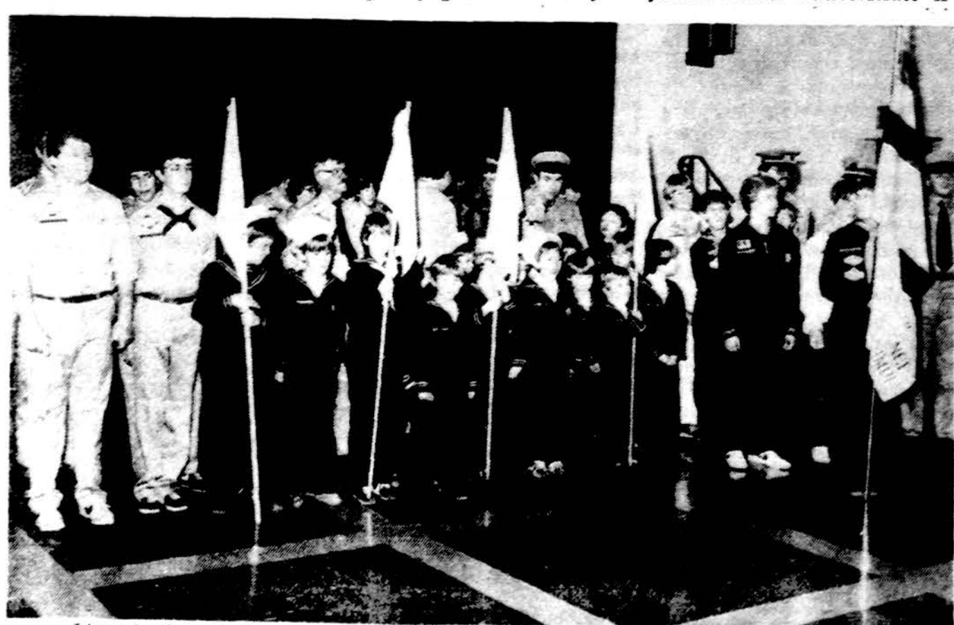
„Lituanicos“ tunto jūr skautų dalis iškilmingoje Klaipėdos dienos sueigoje.