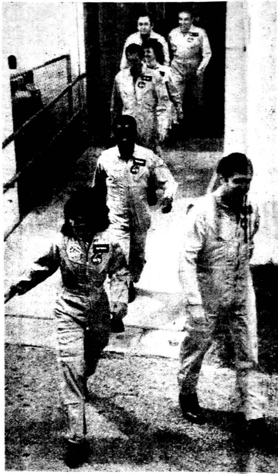
Paskutinė erdvėlaivio „Challenger“ igulos nuotrauka, astronautams einant į pakilimo platformą Kennedy Erdvės centre. Priekyje: dr. Judith A. Resnick, Francis R. Scobee. Už jų: dr. Ronald E. McNair, Michael J. Smith, Christa McAuliffe, pulk. leit. Ellison S. Onizuka ir Gregory B. Jarvis.