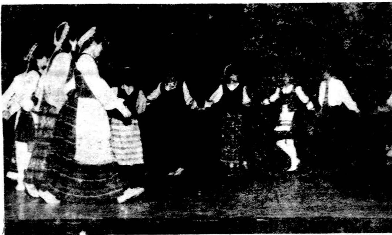
Dariaus Girėno lituanistinės mokyklos mokiniai ruošiasi parodyti ką išmoko tautinių šokių pamokose.