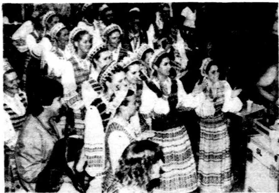
Linksmi šypsosi Grandinėlės sokėjos.

skambinas klasikinės ir lengvosios muzikos kūrinius. Pirmieji vakarai susilaukė gražaus pasisekimo ir įvertinimo. Tikrai maloni ir jauki susitikimo vieta su draugais ir svečiais. „Gintaras“ laukia daugiau lietuvių lankytojų. Klubas 1985 metais turėjo 2050 narių. Šių metų narių pažymėjimai jau parduodami. Jų kaina 5 dol. Klubas prašo atnaujinti senuosius pažymėjimus. Kviečiami nauji nariai. Dabar net 75% narių yra amerikiečiai, kurie lanko klubą ir „Gintaro“ valgyklą. Kaip žinome, klubas skiria kultūrinės premijas pasižymėjusiems lietuvių kultūrininkams ar visuomenininkams.