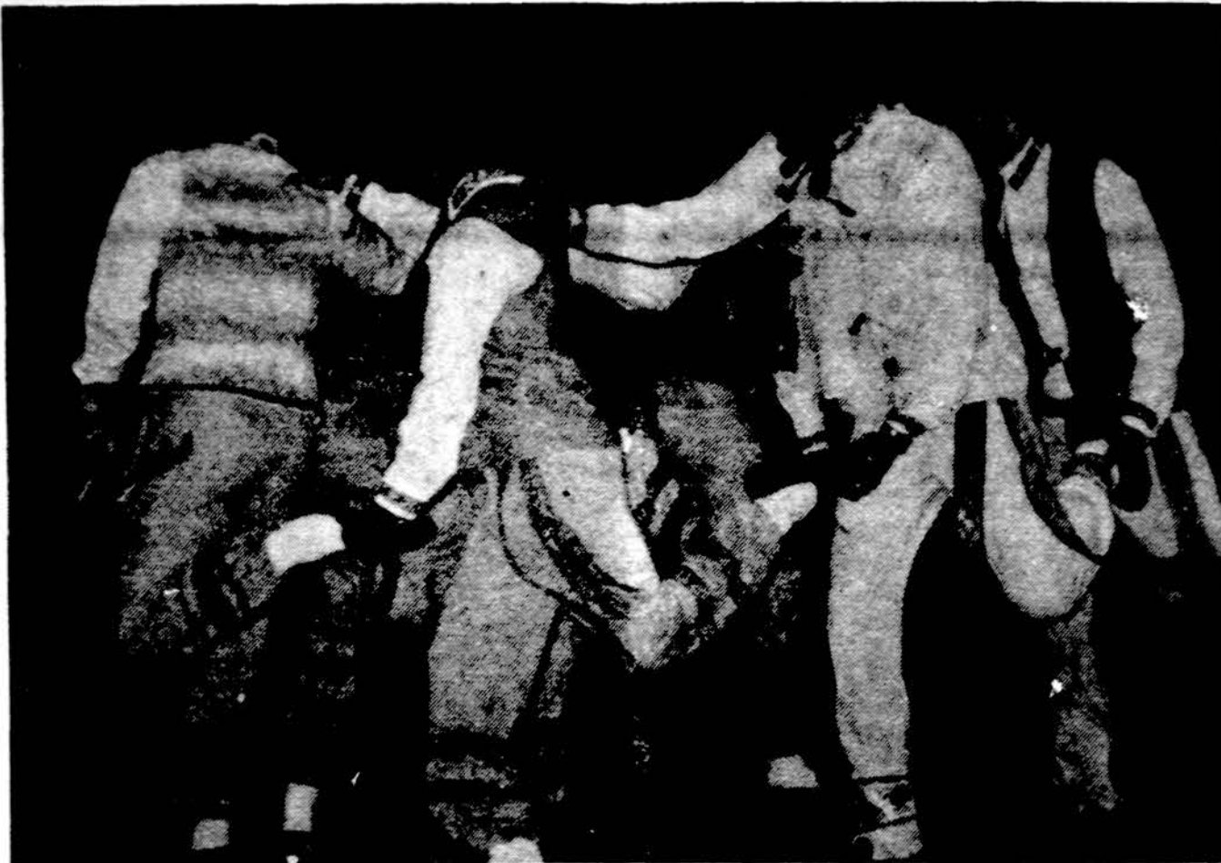
Hartfordo „Berzelio“ tautinių šokių grupė pakelktojo įkarštyje.

Skaitant senuosius raštus apie lietuvių tautą, randama daug vardų, kurie neįtraukti į kalendorius. O nesant kalendoriuose, kažin ar klebonai turi sudarę pilnus lietuviškų vardų sąrašus, nors reiktų. Šiuo kartu daugelis užsienyje vedusių, sulaukusiujų naujų vardų, juos krikštija vardais, nieko bendro neturinčiais su lietuvišiais, visiškai svetimais lietuvių tautai. Kur nors Argentinoje gyvenantieji krikštija ispaniškais ar argentiniais, Vokietijoje — vokiškais,