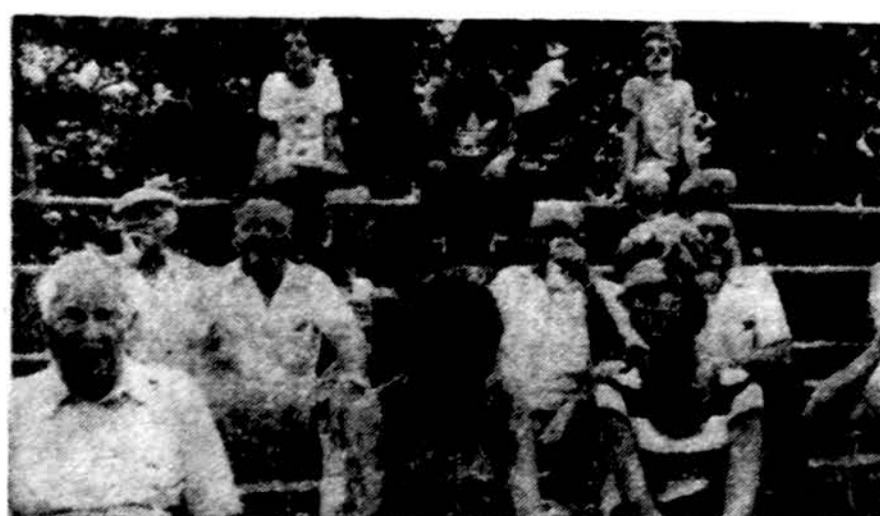
Būrelis futbolo mėgėjų stebi rungtynes Marquette Parke.

Štai kai kurie svarbesni šių paruošiamųjų rungtynių rezultatai: Kanada — Paragvajus