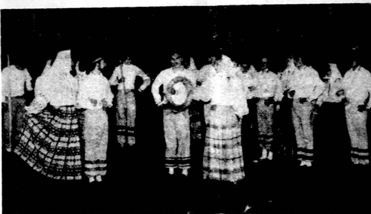
„Berzelio“ tautinių šokių grupė Hartforde atlieka rugapjūtės šokius savo metiniame koncerte.

x Rāmūnės restoranas pradadant šį šeštadienį vasario 15 d., bus atidarytas pusryčiams kiekvieną dieną nuo 8 val. ryto. Pirmadienį uždaryta. Taip pat turime atskirą kambarį privatiems pobūviams. Adresas 2547 W. 69 st., Chicago. Tel.: 476-7975. Labai dėkojame. (sk.)