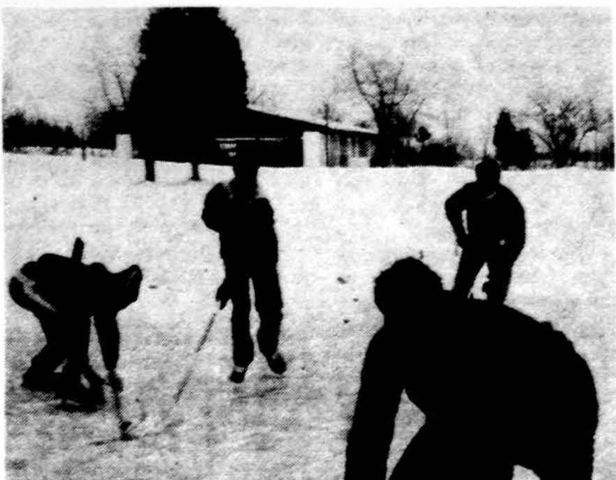
Moksleivių ateitininkų žiemos kursų Dainavoje laisvalaikis buvo praleidžiamas ant Spygio ežero žaidžiant ledo ritulį.