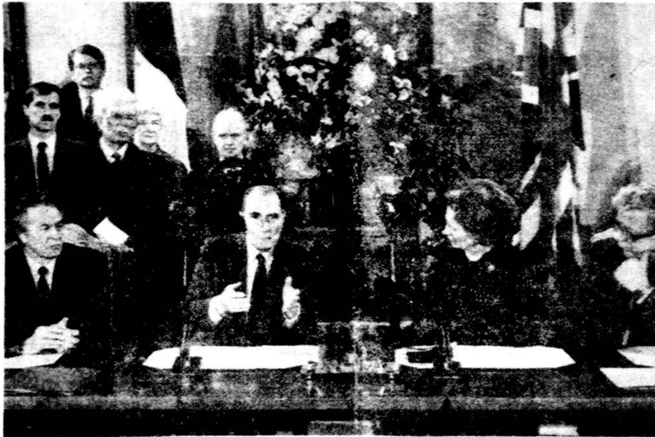
Anglijoje, Canterbury mieste, Prancūzijos prezidentas Francois Mitterrand ir Britanijos premjerė Margaret Thatcher pasirašo sutartį, kuri pradės 31 mylios ilgumo tunelio ir geležinkelio statybą tarp abiejų kraštų. Kairėje sėdi prancūzų užsienio reikalų ministras Roland Dumas, dešinėje — britų ministras Sir Geoffrey Howe. Planai numato, kad tunelis pradės veikti 1993 m.