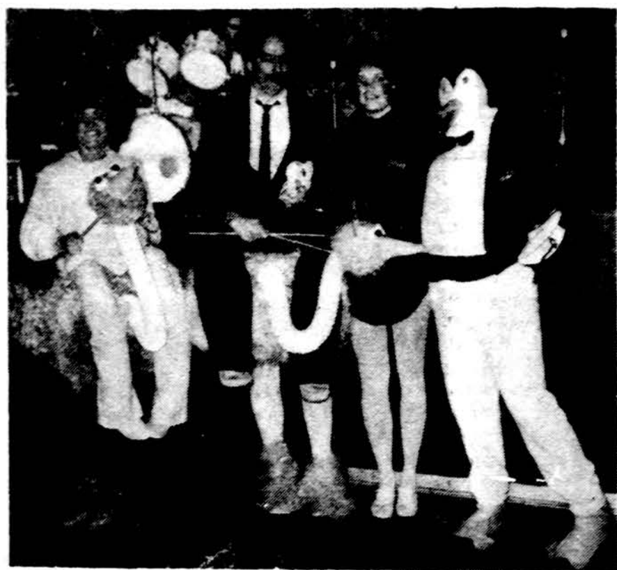
Premijuotos kaukės Detroito Užgavėnių baliuje.