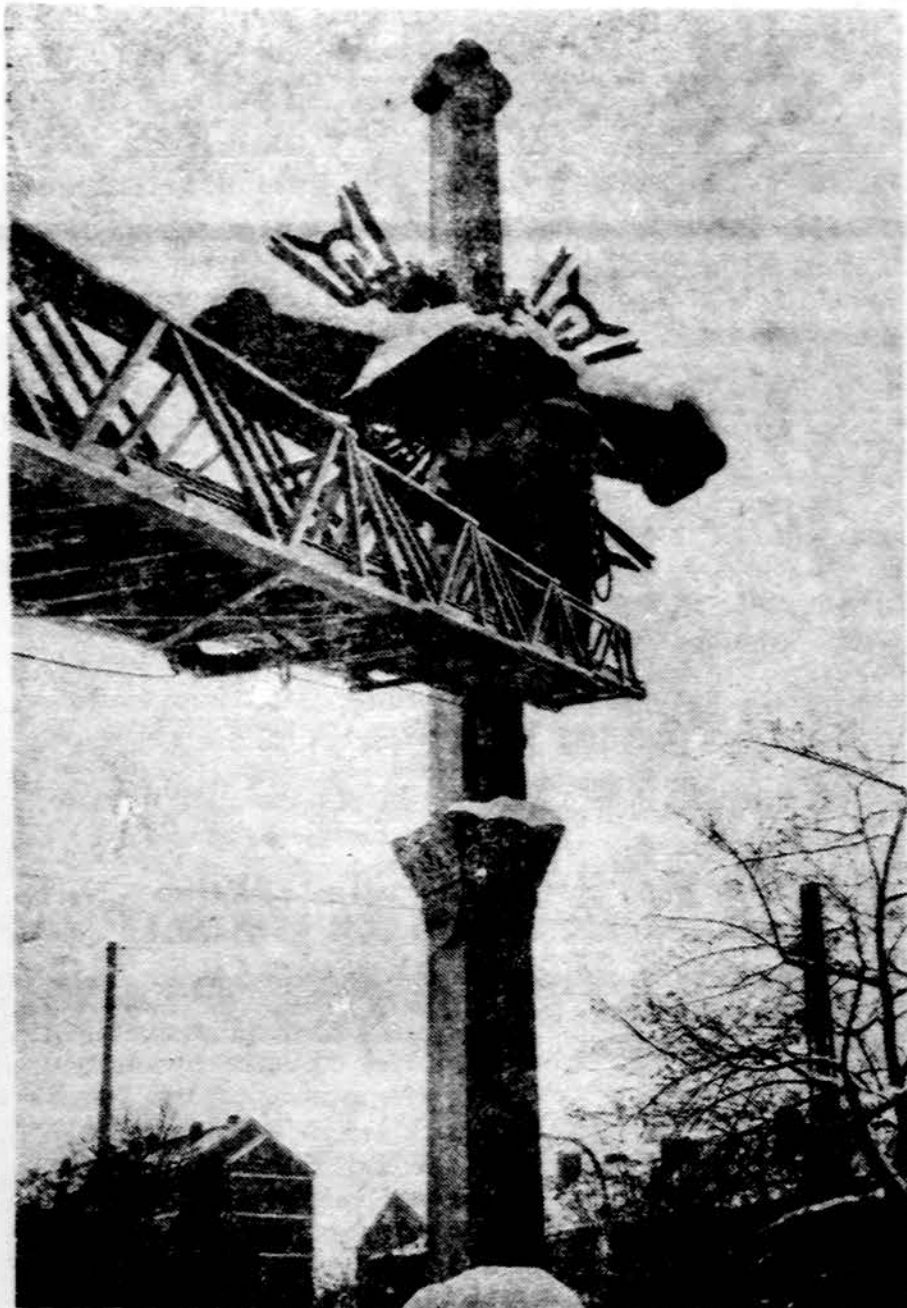
Vakarų Vokietijoje Augsburgio lietuvių kryžius