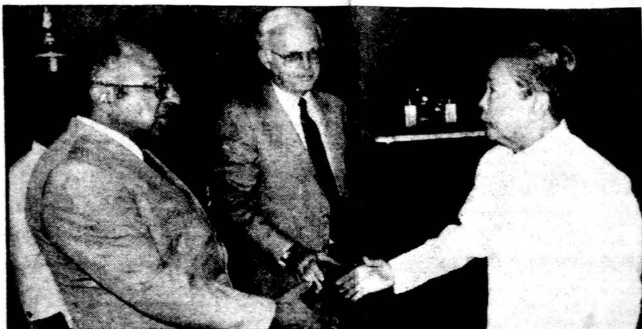
Filipinuose atsisveikina specialus JAV ambasadorius Philip C. Habib ir prezidentas Ferdinand E. Marcos. Už jų stovi JAV ambasadorius Filipinuose Stephen W. Bosworth. Balsavimai neįsprendė Filipinų padėties, nes, oficialiomis žiniomis, prezidentu buvo perrinktas Marcos, turįs Filipinuose ir Amerikoje daug priešių. Prieš jį oficialiai išėjo ir Filipinų katalikų Bažnyčia.

— Nikaragvos sukilėliai apšaudė autobusą, žuvo 5 civiliai, 8 sužeisti.