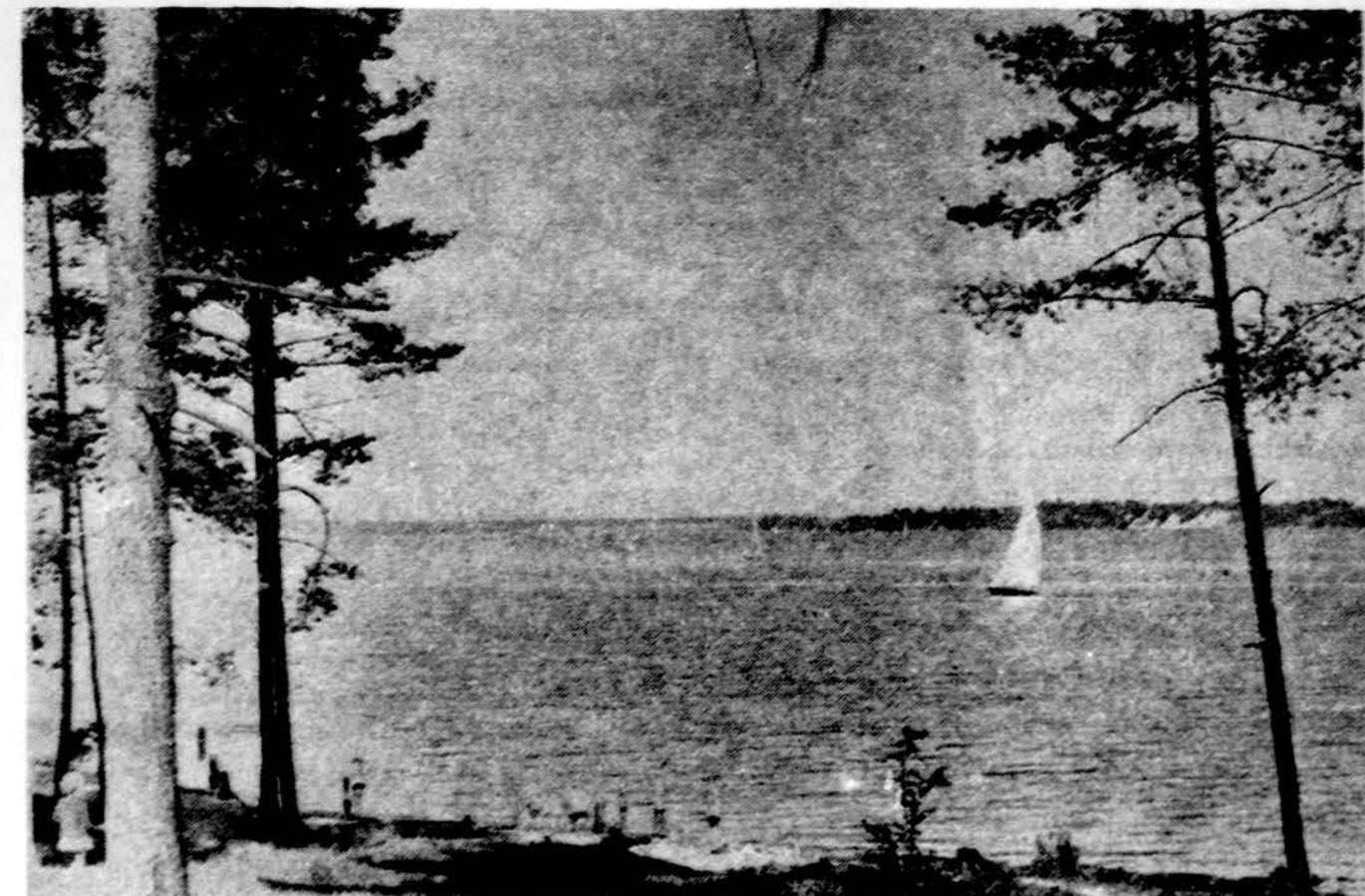
Kauno marios ties Pažaisliu

Užakymus siųsti: DRAUGAS, 4545 W. 63rd St., Chicago, IL 60629