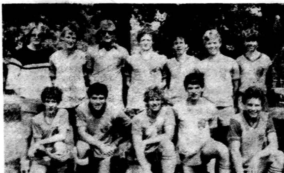
„Lituanicos“ futbolo klubo jaunieji.

Europos krepšinio čempiono taurės turnyre iki šiol daugiausiai taškų surinkusiai krepšinio komandai Kauno „Žalgiriui“ visuose italų laik-