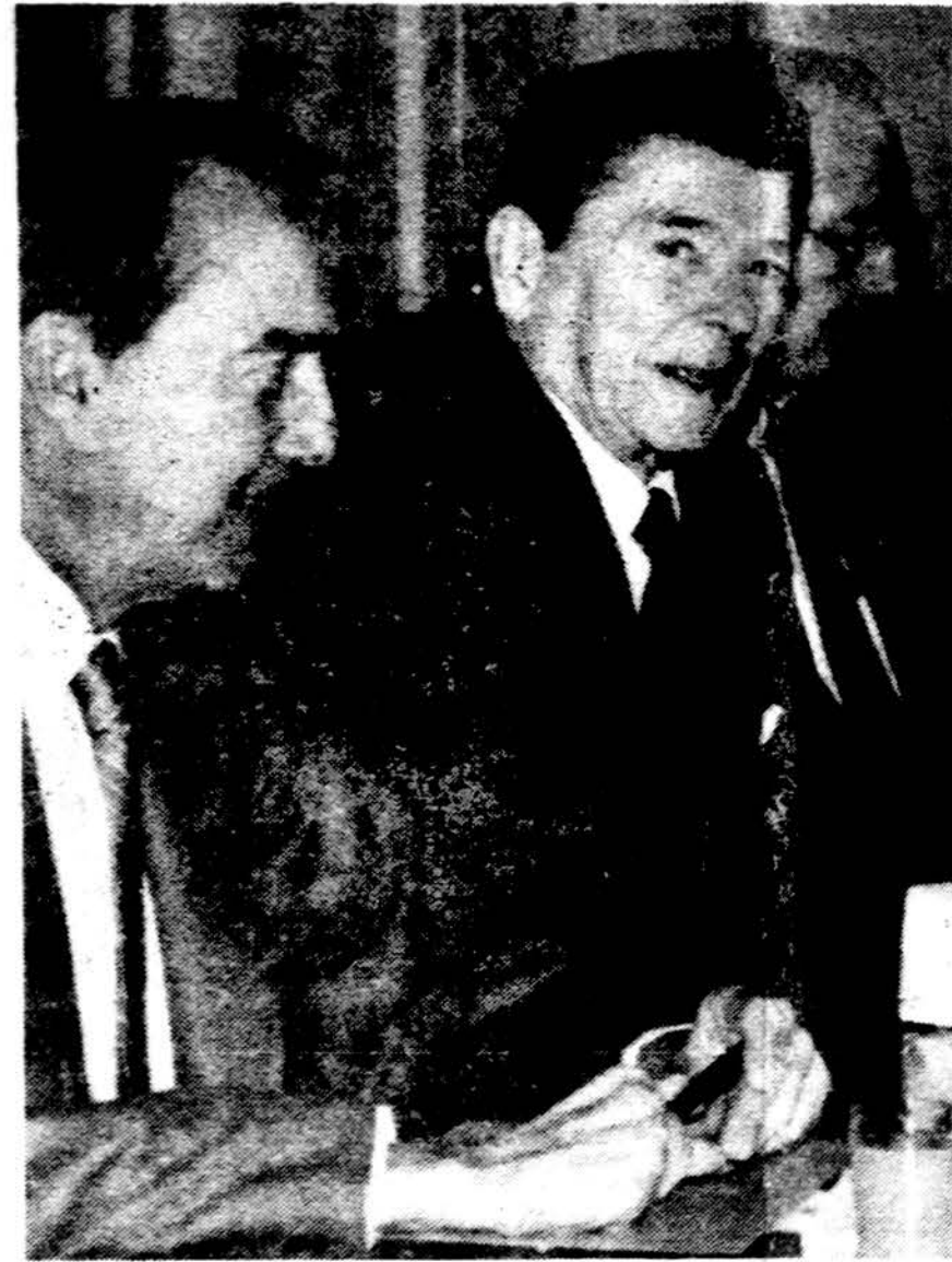
Prezidentas Reaganas tarėsi su Kongreso respublikonų vadais. Nuotraukoje su prezidentu (kairėje) senato daugumos vadas sen. Bob Dole ir Atstovų Rūmų mažumos vadas Robert H. Michel iš Illinois.

— Portugalijoje sprogo bomba, įdėta į JAV marinių karininko automobilį. Sprogimas padarė nedidelį nuostolį JAV ambasada. Bomba pasigyrė padėjusi portugalų komunistų grupuotė.