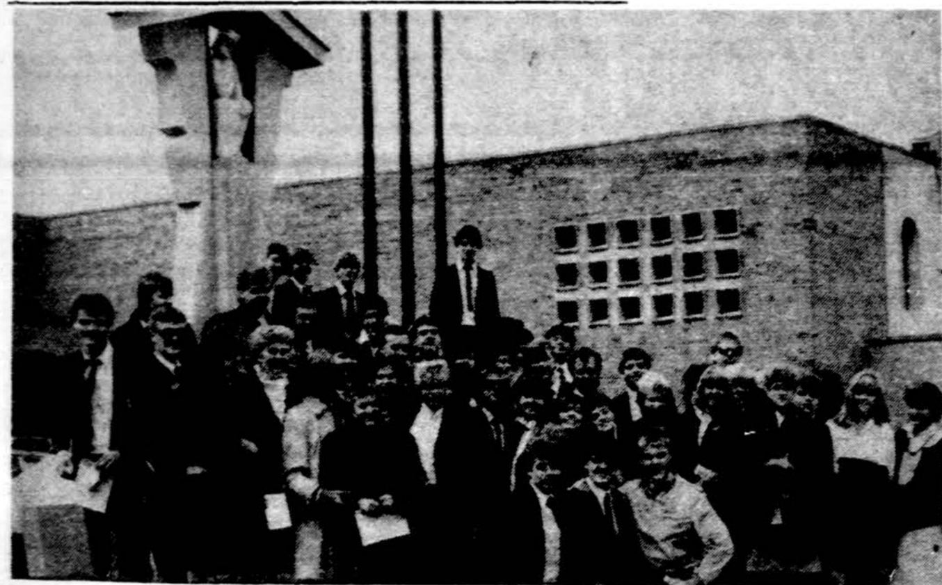
Chicagos „Grandis“ po koncerto Clevelande.