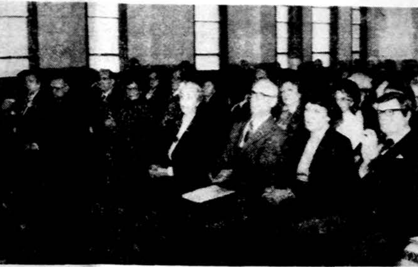
Dalis žiūrovų Cicero LB Vasario 16-tos minėjime.