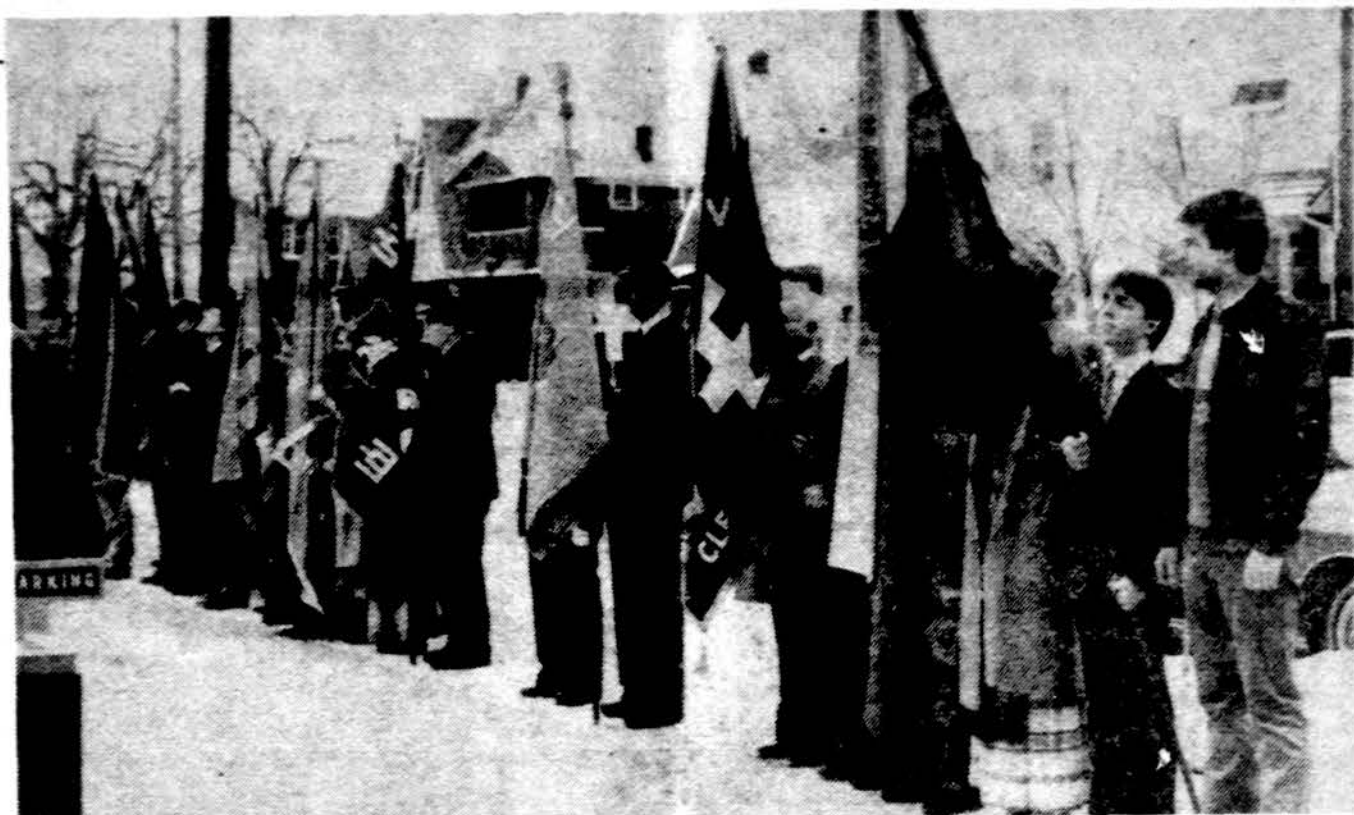
Organizacijų vėliavos prie Laisvės paminklo Vasario 16-tąją Clevelande minint.