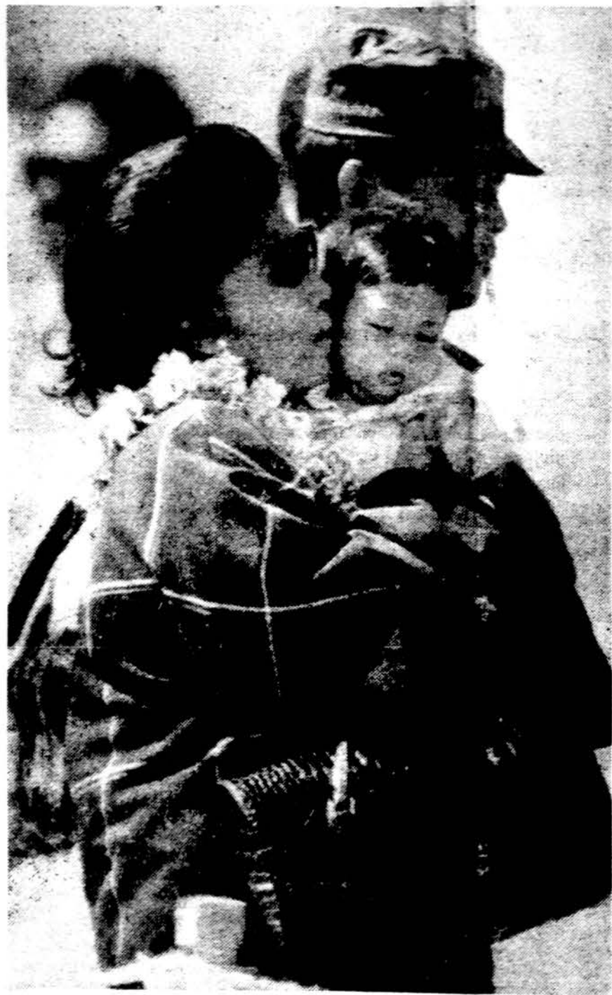
Buvusioji Filipinų „pirmoji lady“ Imelda Marcos, nauja tremtinė, atvyko į Havajus su vienu iš savo vaikų rankose. Havajų gubernatorių sutiko svečius su geliiu vainikais.

— Izraelio ambasadorius Ispanijoje įteikė savo kredencialus karaliui Juan Carlos. Diplomatiniai santykiai buvo užmezgti prieš mėnesį.