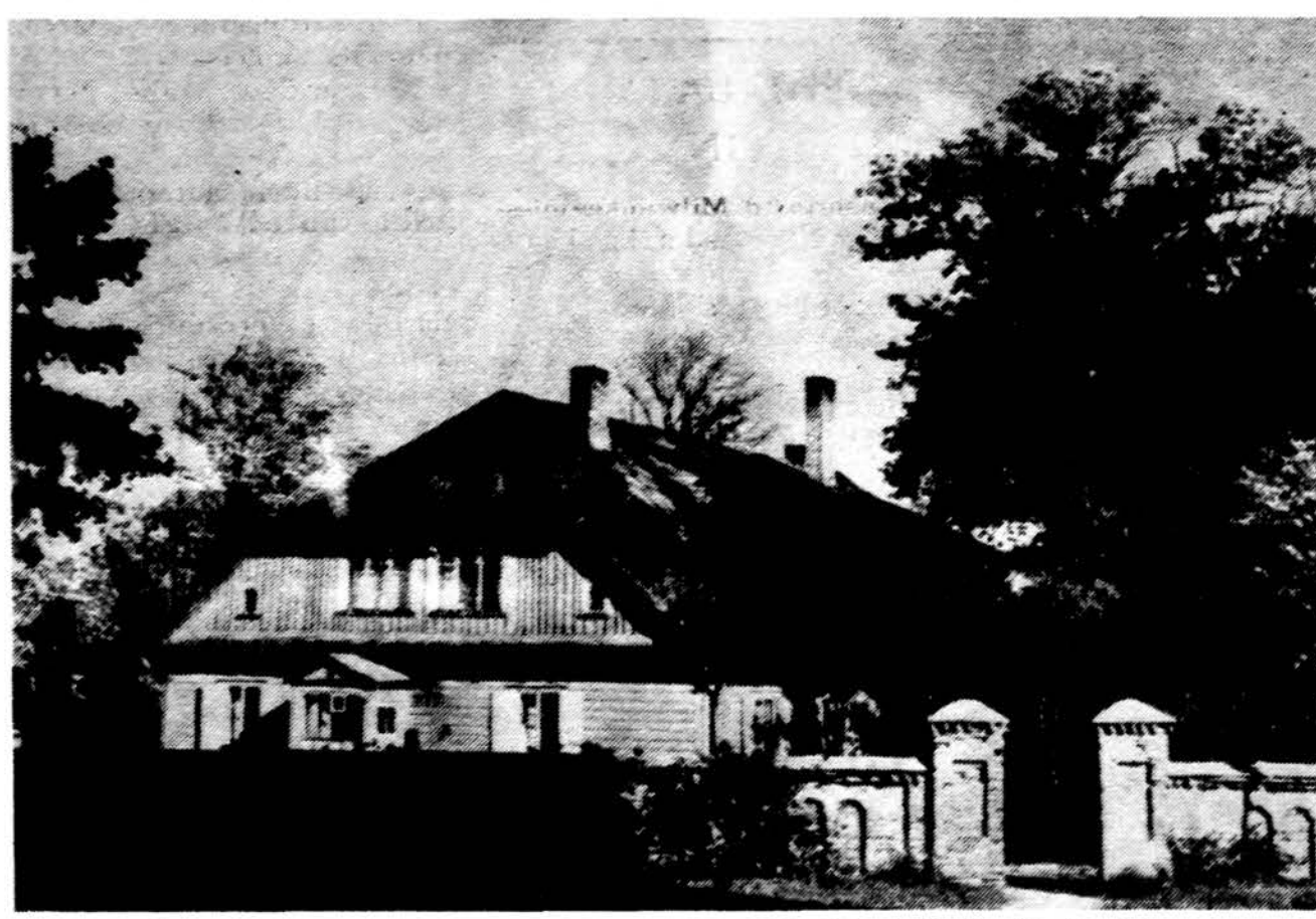
Plungė. Namas, kuriame yra atostogavęs Mikalojus ir Sofija Čiurlioniai.

Kiekvieną paskutinį mėnesio sekmadienį, Varšuvos šv. Stanislovo bažnyčioje yra aukojamos šv. Misijos už Tėvynę, į kurias atvyksta tikintieji net iš tolimų Lenkijos vietovių. Šių pamaldų tradiciją pradėjo milicininkų nužudytas ir toje pačioje šv. Stanislovo bažnyčioje palaidotas kunigas Popieluszkos. Sekmadienį, sausio 26 d., pamaldose už Tėvynę Varšuvoje dalyvavo daugiau negu aštuoni tūkstančiai tikinčiųjų, jų tarpe gausios dabar uždraustos laisvosios profesinės sąjungos „Solidarumo“ delegacijos iš visos Lenkijos, taip pat skaitlingi Varšuvos universiteto studentai, prie kurių buvo prisijungę jų bičiuliai iš Lomonosovo universiteto Maskvoje.