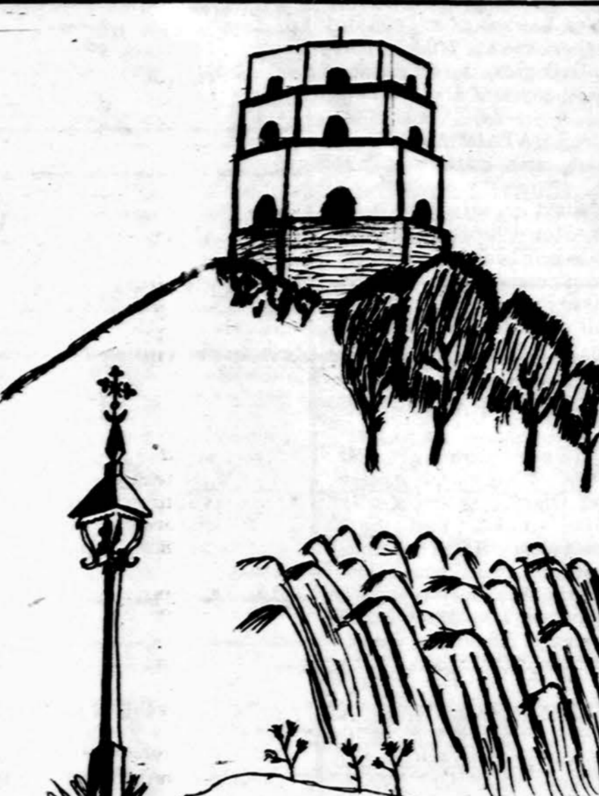
„Gedimino kalne milžinai atbus“... Piešė Jonas

Isteigtas Lietuvių Mokytojų Sąjungos Chicago skyriaus