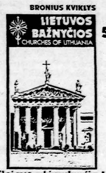
Vilniaus arkivyskupija I

Illinois gyventojai dar pridėda $1.60 valstijos mokesčio.