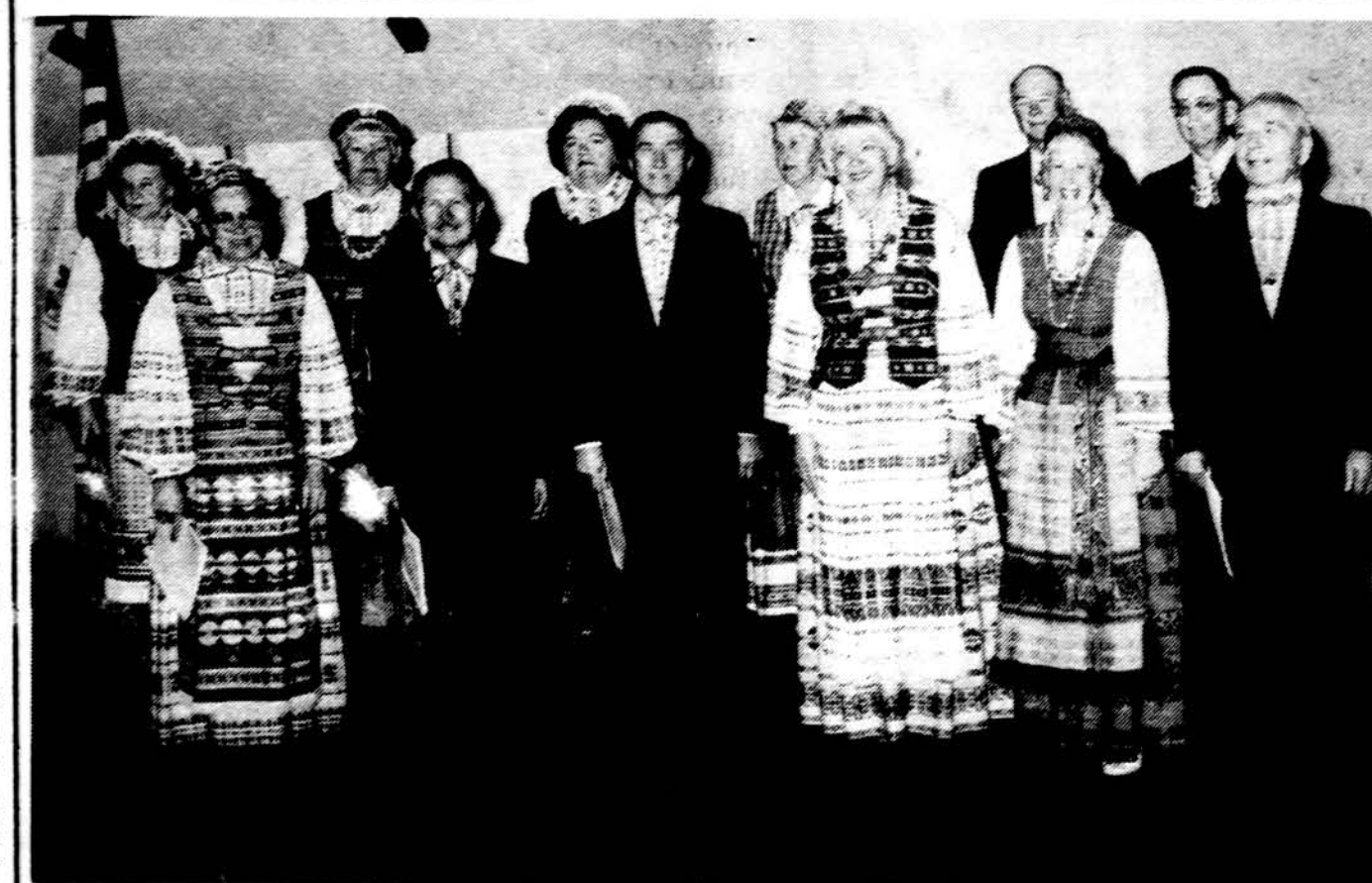
Pompano Beach Vasario 16-tosios minėjimo programą atliko D. Mackialienės vadovaujamas „Sietynas“ iš Daytona Beach.