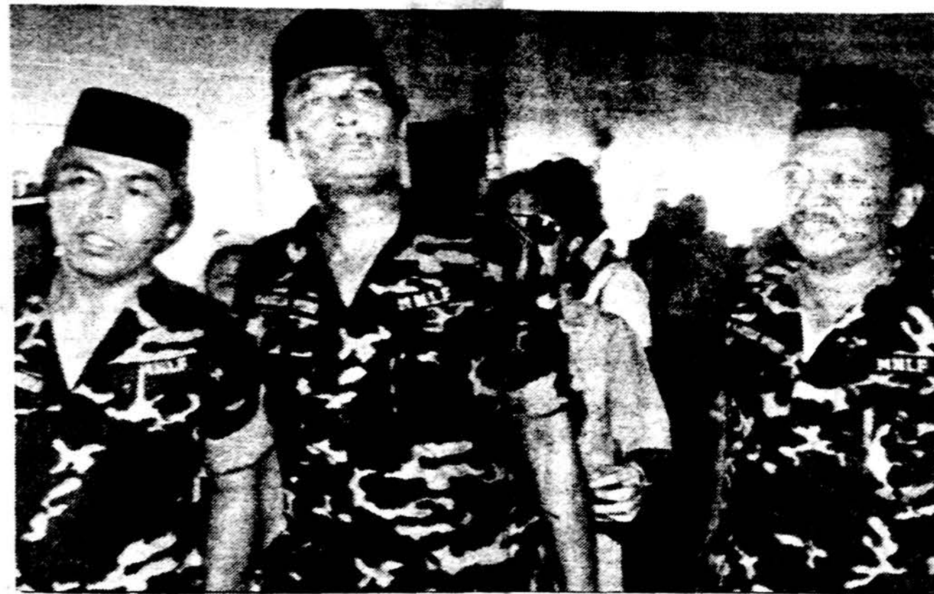
Iš Malaizijos į Filipinus sugrįžo trys Mori Nacionalinio Išvadavimo Fronto vadai. Ši musulmonų grupė jau nuo 1972 m. kovoja už musulmonų apgyventų žemių Mindanao saloje autonomiją ir net nepriklausomybę. Kovose žuvo 50,000 žmonių. Paskutiniu metu kovos kiek aprimo. Naujoji vyriausybė Filipinuose pakvietė fronto vadus grįžti iš egzilės ir tartis dėl santykių pagerinimo. Filipinuose gyvena apie 6 mil. musulmonų, apie 10 nuos. visu gyventojų.

Šio teismo sprendimas kai kurios prancūzų spaudos kritikuojamas, nes iki šiol Barbie nevolausia teismo. Buvo planuojama jį teisti šį mėnesį, po Prancūzijos rinkimų. Dabar, galimas daiktas, teismas bus atidėtas iki 1987 metų.