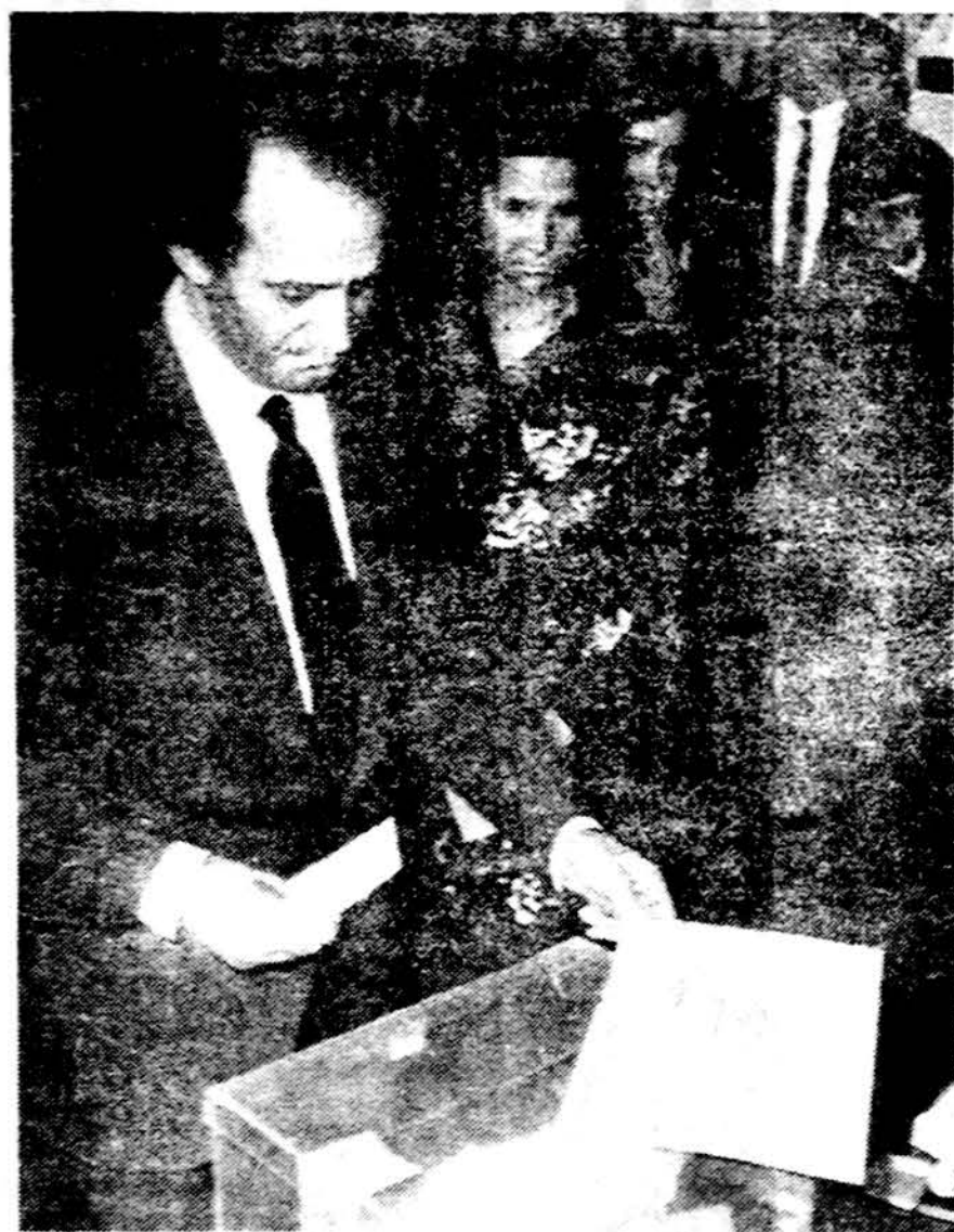
Ispanijos karalius Juan Carlos I balsuoja ispanų referendume, kuris nusprendė, kad Ispanijai reikia pasilikti Šiaurės Atlanto gynybos sutarties narę (NATO). Už karalius — dvi jo dukterys: princesės Christina ir Elena. Karalius nesakė, kaip jis balsavo, tačiau jo balsavimas, plačiai išgarsintas Ispanijos televizijos, buvo smūgis toms partijoms, kurios ragino balsavimą boikotuoti.