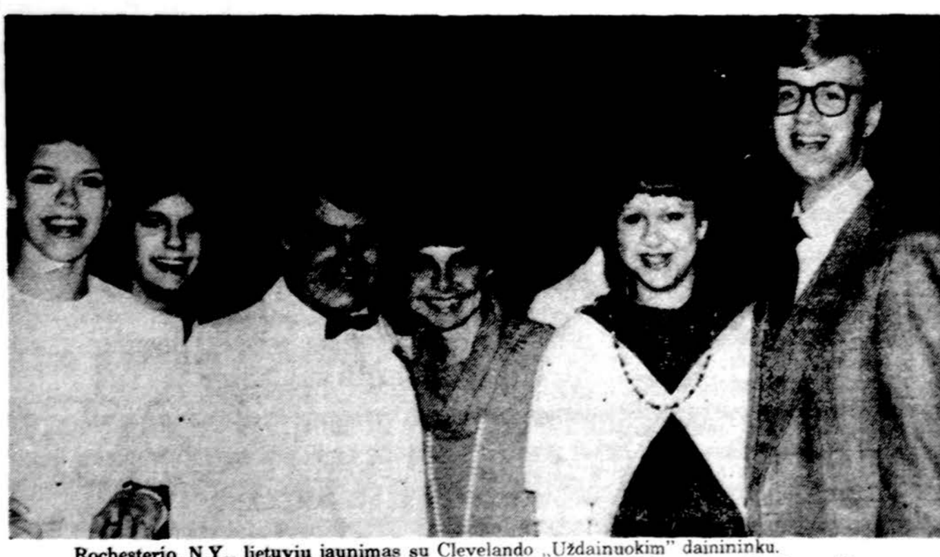
Rochesterio, N.Y., lietuvių jaunimas su Clevelando „Uždainuokim“ dainininku. Nuotr. V. Bacevičiaus