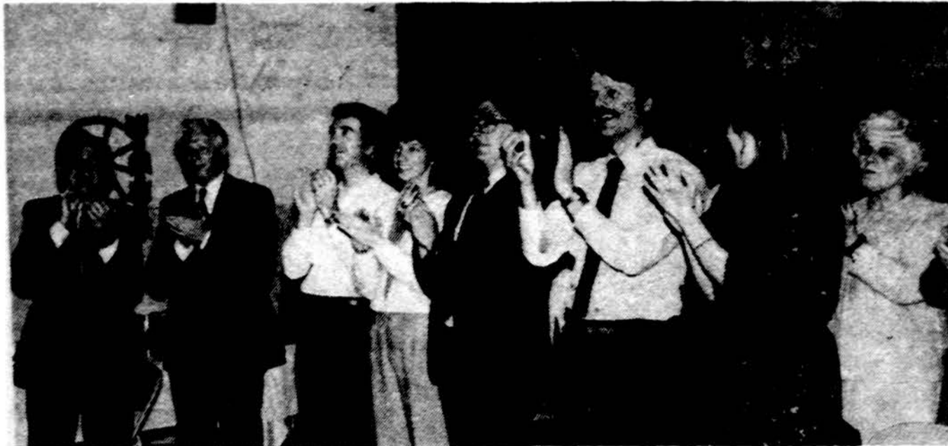
Labai patiko Rochesterio, N.Y., lietuviškam jaunimui vieneto „Uzdainuokim“ koncertas.

x „Daina“ jaunų olandų muzikinis ansamblis , atliks lietuvių liaudies dainų programą kovo 30 d. 4 val. p.p. ir balandžio 2 d. 7:30 v.v. Rengia akademikai skautai.