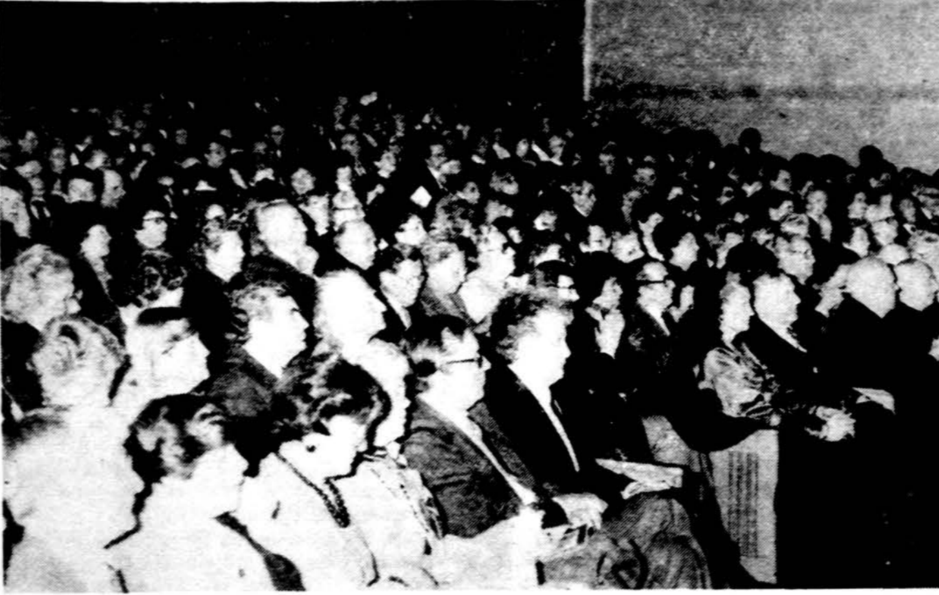
„Draugo“ koncerto, vykusio kovo 16 d., Marijos aukšt. mokyklos salėje dalis klausytojų.