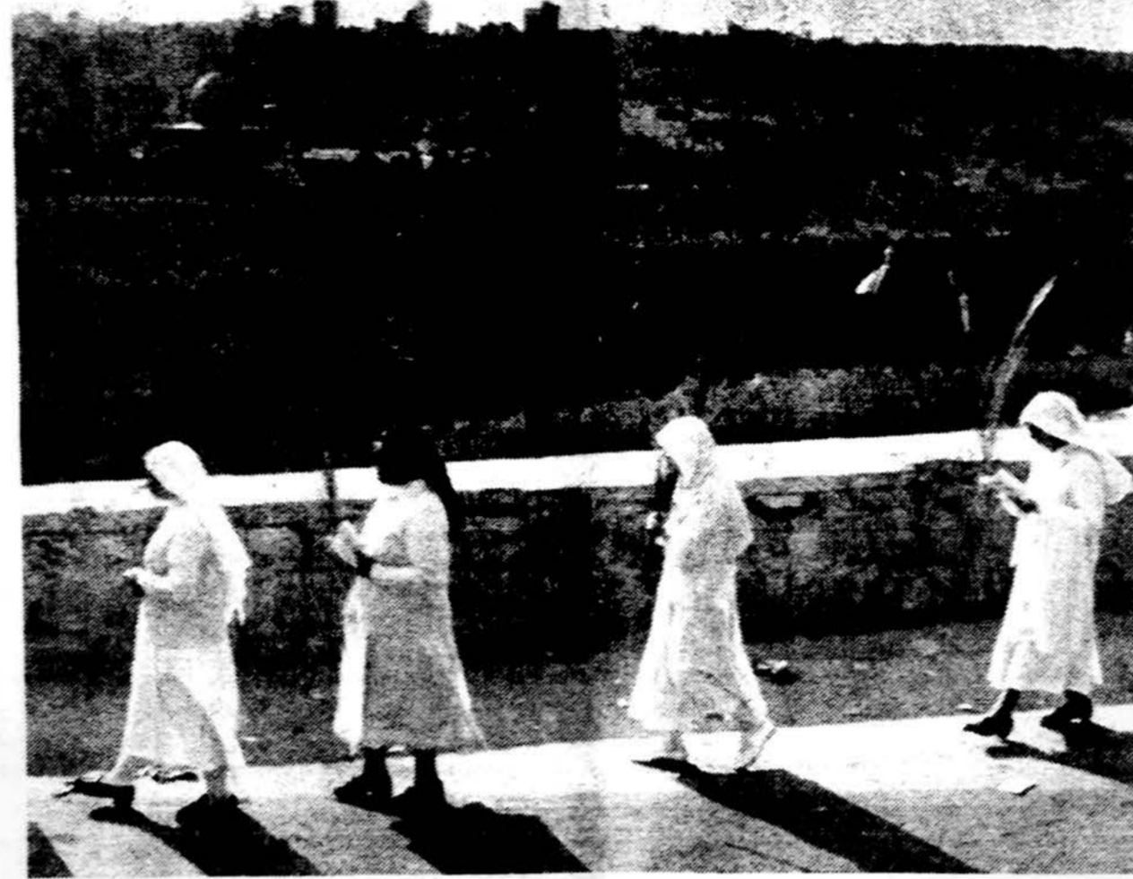
Jeruzalėje. Verbų sekmadienį, vienuolės žygiuoja procesijoje iš Alyvų kalno į Jeruzalės Ceremonijose dalyvavo tūkstančiai piligrimų iš viso pasaulio. Tuo buvo pradėta Didžioji Savaitė.

Sovietų spauda ir televizija išvystė plačią propagandą prieš bandymus Nevados dykumoje. Pravda rašo, jog Amerikos vyriausybė nesiskaito su pasaulio opinija, nesiskaito nė su savo piliečių reikalavimais užbaigti sprogdinimus. Visoje Amerikoje vyksta didelės demonstracijos, kur publika protestuoja prieš vyriausybės trumparegiškumą, rašo sovietų laikraštis.