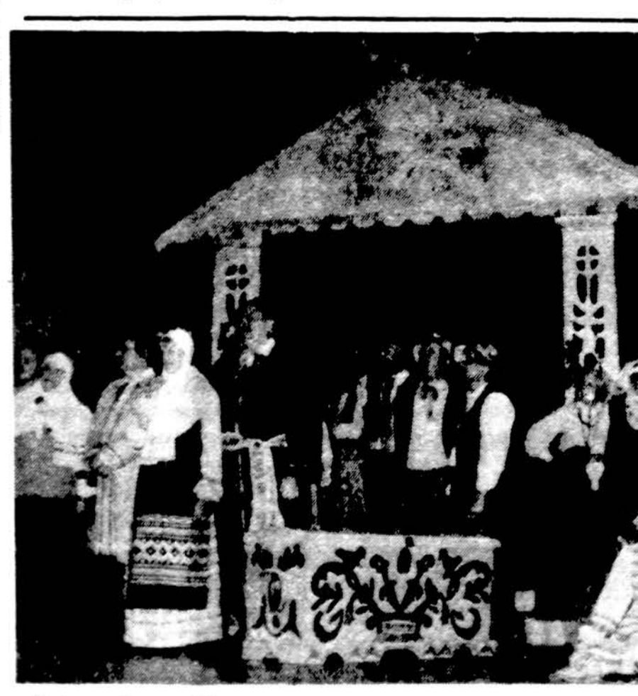
„Dainavos“ ansamblio vestuvių patatyje 1985 metais.

Dainava 1985 m. gruodžio 8 d. amerikiečių kviečiama jų visuomenei parodė lietuviškų vestuvių dainų ir šokių spektaklį Chodl auditorijoje, Cicero, IL, dalyvaujant Lemonto šokių grupei Spinduliui. Amerikiečius tas labai sudomino. Dabar pasiryžta lietuvių publikai suruošti spektaklį gegužės 11 d. Marijos aukšt. mokyklos salėje, kaip tik moti-