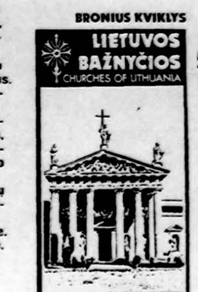
Vilniaus arkivyskupija I

Illinois gyventojai dar prideda $1.60 valstybos mokesčio.