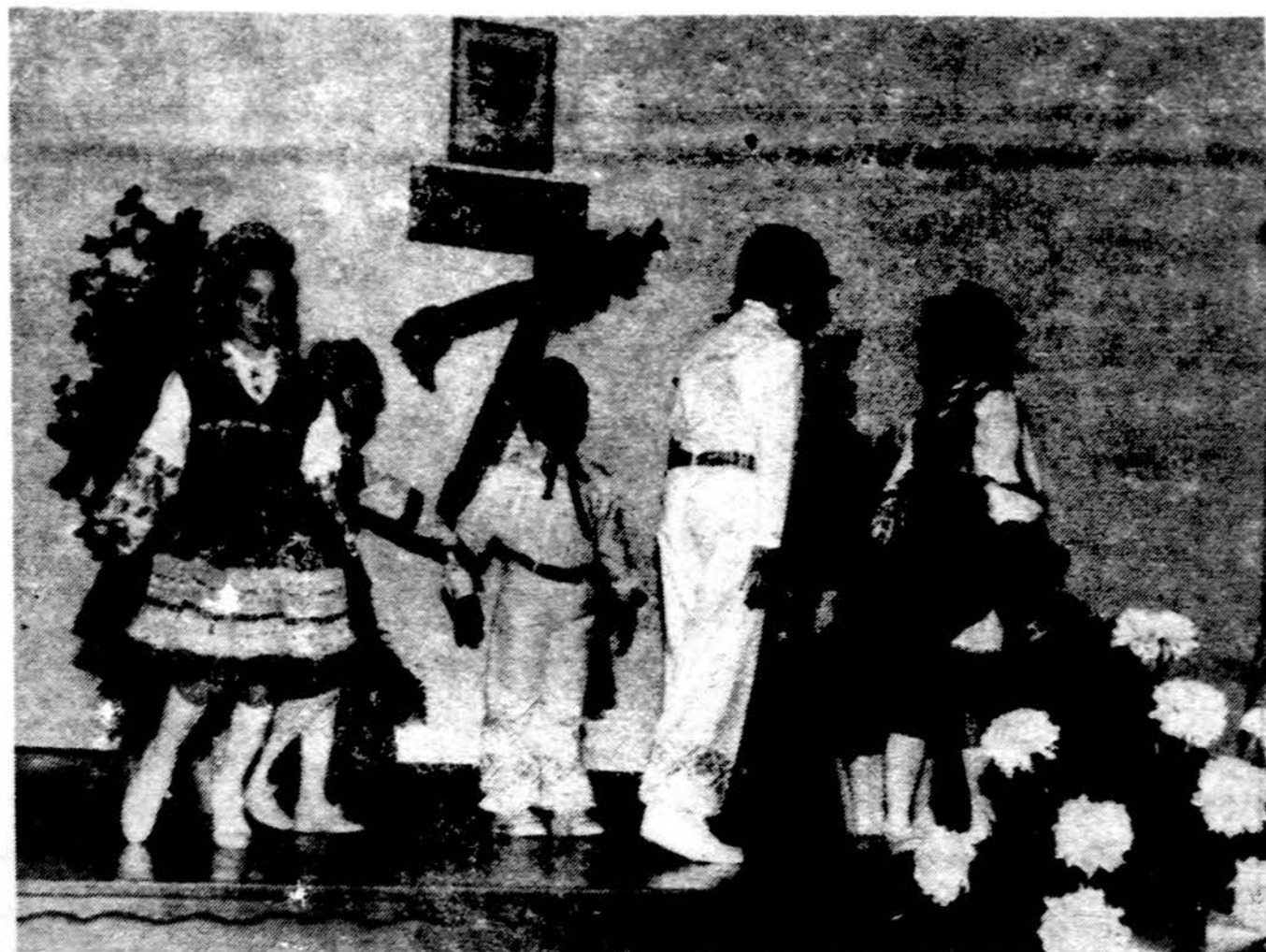
Dalis jaunujų „Aušros“ šokėjų Omahoje.