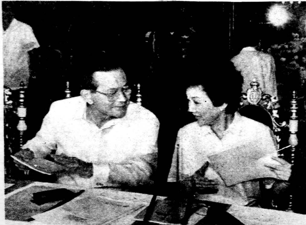
Filipinų naujosios vyriausybės posėdžiui vadovavo prezidentė Corazon Aquino ir viceministras Salvador Laurel. Filipinų spauda rašo, jog policija pagavo vieną vagių, kuris tvirtina, jog vienas armijos generolas jam siūlė 25,000 dol., jei jis nušautų prezidentę Aquino. Teisingumo ministerija tiria, ar tas nusikaltėlis kalba tiesą, ar tik bando pagarsėti.

Libijos vadovas grasino duoti instrukcijas Arabų Revoliucijos komandai imtis žygių prieš Ameriką, prieš civilių ir necivilių taikinius visame pasaulyje. Visiems bus aišku, kad Reagano administracija bus atsakinga, o ne mes, jei kils grėsmė Amerikos mies-