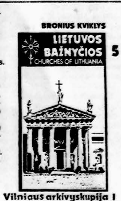
Vilniaus arkivyskupija I

Illinois gyventojai dar pridėda $1.60 valstyės mokesčio.