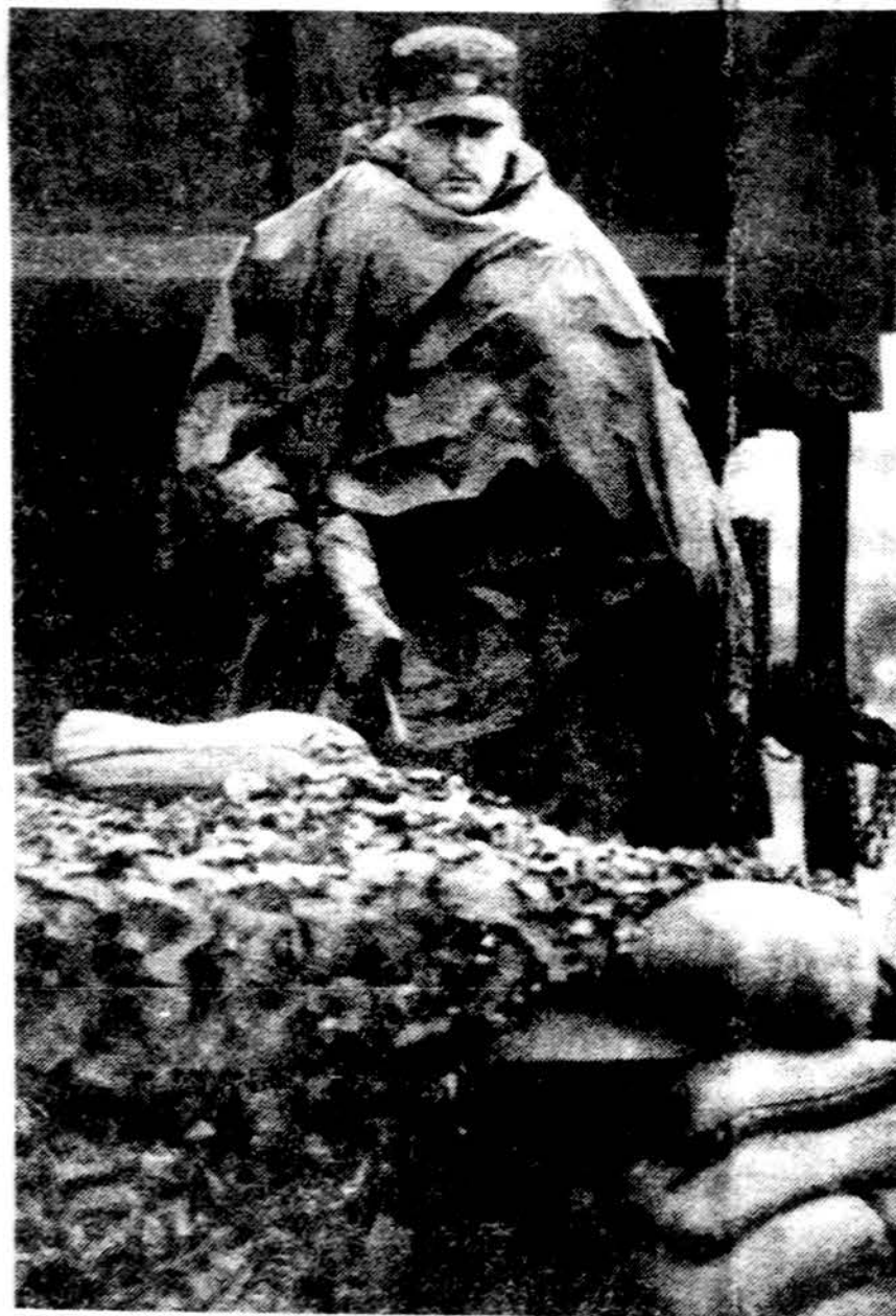
Didžiojoje Britanijoje praėjusį savaitgalį įvyko daug demonstracijų prie karinių bazų. Nuotraukoje amerikietis sargybinis prie Lakenheath JAV aviacijos bazės, į kurią sugrįžo Libiją bombardavę F-111 lėktuvai.

— Izraeliui pareigas pradėjo pirmasis Ispanijos ambasadorius. Jis pasakė prezidentui Herzogui, kad Ispanijos PLO organizacijos pripažinimas nepalies Ispanijos santykių su Izraeliu.