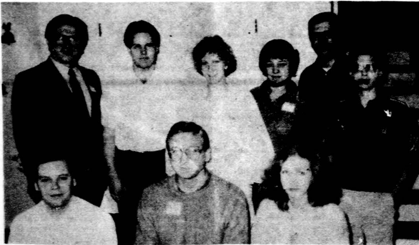
JAV LB Lansingo, Mich. apylinkės steigėjų susirinkimo dalyviai.

Vokiečiai pasikarščia, bausdami lietuvius, atiduodami mus bolševikams – rusams komunistams, kartu nubaudė patys ir save. Rytų fronto išeities linija turėjo atkelti atgal ir vakarus iki Rytprūsių ir Klaipėdos apie 300-400 km ir tas jiems gana brangiai kainavo. Atsisakymas atsiimti Vilnių buvo neapgaltas istorinė klaida