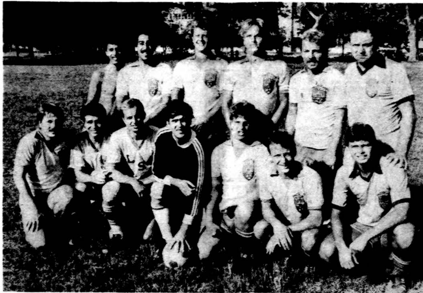
Chicago lietuvių futbolo klubo „Lituania“ vyrų pirmoji komanda.