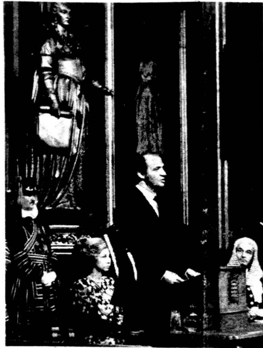
Ispanijos karalius Juan Carlos pasakė kalbą Britanijos parlamento abiejų rūmų sesijoje. Kalba istorinė, nes joks užsienio monarchas nėra kalbėjęs britų parlamente. Šalia karaliaus sėdi žemųjų parlamento rūmų pirmininkas Bernardas Weatherill, iš kitos pusės — karaliaus žmona karalienė Sofija. Karalius pareiškė viltį, kad bus galima išspręsti Britanijos — Ispanijos ginčus dėl Gibraltaro, kurį britai valdo jau nuo 1713 metų.

Jie yra liudytojai. KGB juos vadina ekstremistais. Bet būti minimalistu, o ypatingai dvasiniu minimalistu — prazūtinga. Užtenka mums netikrų, valdžiai patogių vyskupų, užtenka nieko neganančių ganytojų. Atvirai ir nuosirdžiai pareiškime: nežinome iš mūsų tarpo tokio jauno žmogaus: kuris, kad ir ne viską suprasdamas, nebūtų širdimi su kun. Alf. Svarinsku. Tik tarp vyresniųjų, turinčių ilgesnį išlepimo stažą, atsiranda ramybės gynyją. Argi galima būti ramiam, mėgautis dvasiniu komfortu, kai aplink siaučia prievarta, kai kas nors kankinamas už priešinimąsi prievartai?