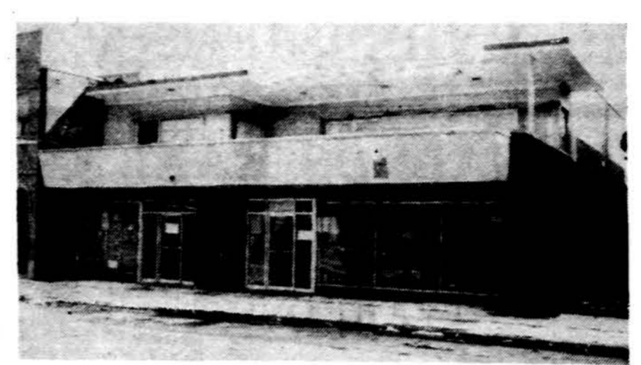
JAV LB Socialinių reikalų tarybos naujoji būstinė Chicagoje. Apačioje įstaiga ir salė, viršuje – gyvenamosios patalpos.