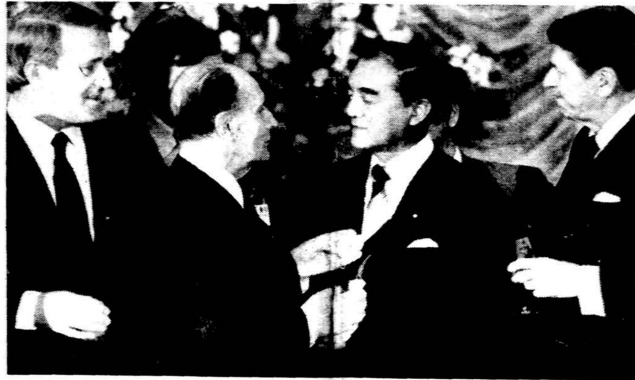
Demokratinę pramonės valstybių konferencijoje Prancūzijos prezidentas Francois Mitterrand kalbasi su Japonijos premjeru Yasuhiro Nakasone. Netoliese stovi prezidentas Reaganas (dešinėje) ir Kanados premjeras Brian Mulroney.

— Sudane nutarta sudaryti koalicinę vyriausybę. Rinkimus laimėjo dvi partijos: Umma ir Demokratų unija. Premjeru bus Umma vadas. Iš 18 ministrų ta partija valdys 8.