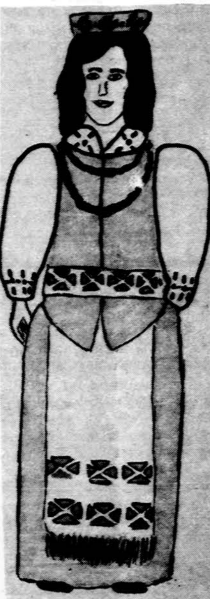
Lietuvė mamytė Piešė Ingrida