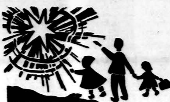
Redaguoja J. Placas. Medžiagą siūsti: 3206 W. 65th Place, Chicago, IL 60629

x Red. Gražių mintių išreikšė Pasaka. Moteris – mama yra verta didelės pagarbos, tačiau dažnai pamirštama. Artinasi Motinos diena. Nors tą dieną nereikia pamiršti savo mamų. Ne tiek svarbu brangios dovanos, kiek meilė, nuoširdumas, paklusnumas ir pagalba jos darbuose. Jei jūs jai tai duosite, ji bus laiminga ir dėkinga. Ar ne gražu žmogų padaryti laimingą? Žinoma, ir tai nesunkiai įvykdoma. Tik geros valios ir tvirtos pasiryžimo!