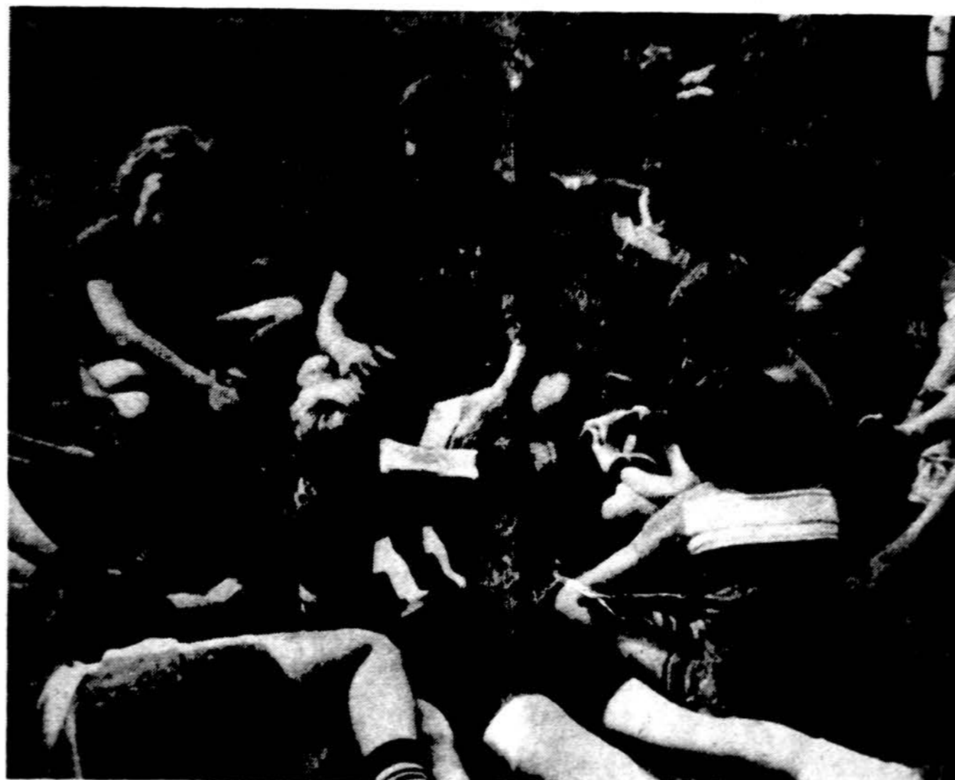
Smagu su draugais pasikalbėti „Neringoje“. Vasaros stovyklos puiki proga susipažinti ir draugauti su lietuviškais iš įvairių miestų.

1446 South 50th Avenue Cicero, Illinois Telefonas — 652-1003