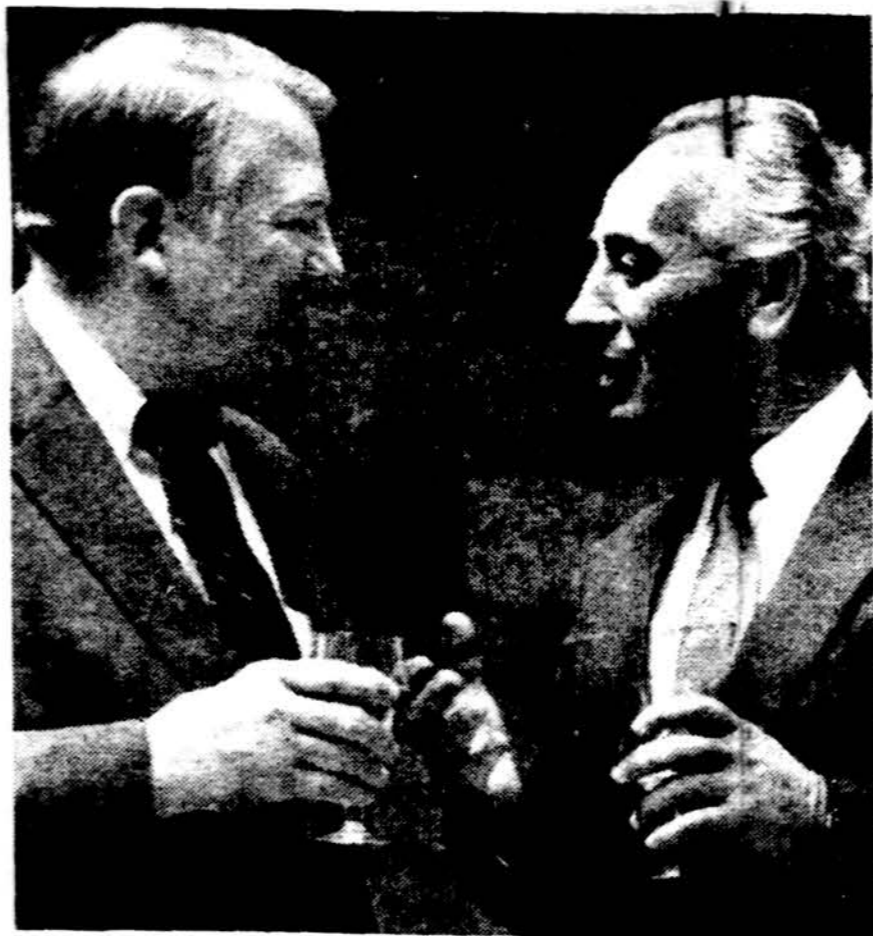
Valstybės prokuroras Edwin Meese kalbasi su Izraelio premjeru Shimon Peres Jeruzalėje, kur prokuroras lankosi. Izraelio spauda daug rašo apie Sirijos kariuomenės judėjimą ir naujų apkasų statybą sirų valdomoje Libano dalyje. Tie apkasai tinka ne tik Sirijos artilerijos pabūklams, bet ir prištankiniams bunkeriams. Sirijos spauda rašo, jog Izraelio kariuomenė rengiasi pulti Siriją.