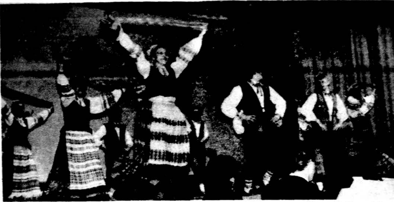
„Grandinėle“ Vasario 16-tosios minėjimo programoje.

Nesigilindami į Amerikos biznio apimtį, į visuomenės lėšomis pastatytus dangoraižius ir į milijonus žmonių, kurie tuose dangoraižiuose duoną ir ateitį užsidirba, pažvelkime į mūsų pačių, nors ir ribotą, biznio ir finansų sritį. Individualiai jau turime nemažą būrį tautiečių, kurie suprato krašto sąlygas ir pajungė finansų srovę savo naudai. Kiek iš to sluoksnio turtų nuberjo visuomenė, sunku pasakyti. Skaitydami spaudą, pastebime šen ten minimus mecenatus, kurie tūkstantinėmis arba šimta tūkstantinėmis sumomis parėmė ir remia lietuvišką veiklą. Turime tuo tik džiaugtis. Bet yra ir kita lietuvių biznio apraška – lietuviškos finansinės institucijos, sukurtos akcininkų arba narių kooperatyviniiais pagrindais. Šios institucijos yra ne tik naudingai pajungusios savo dalininkų išteklius, bet sugeba jais laviruoti taip, kad vadinamieji „šerikai“ gauna asocius vertingo atpildo. Iš tikrųjų atpildas tenka ne tik nariams, bet ir jų visuomenėi. Paminkime Kanados lietuvių bankelius, kooperatyvus ar kredito unijas – Paramą, Talką, Litą, Prisiškelimo parapijos kooperatyvą arba Amerikoje – Kasą, Taupą ir dar porą mažesnių Kalifornijoje. Visas sudejus į krūvą, turėsime apie 200 milijonų kapitalą. Kokia iš to