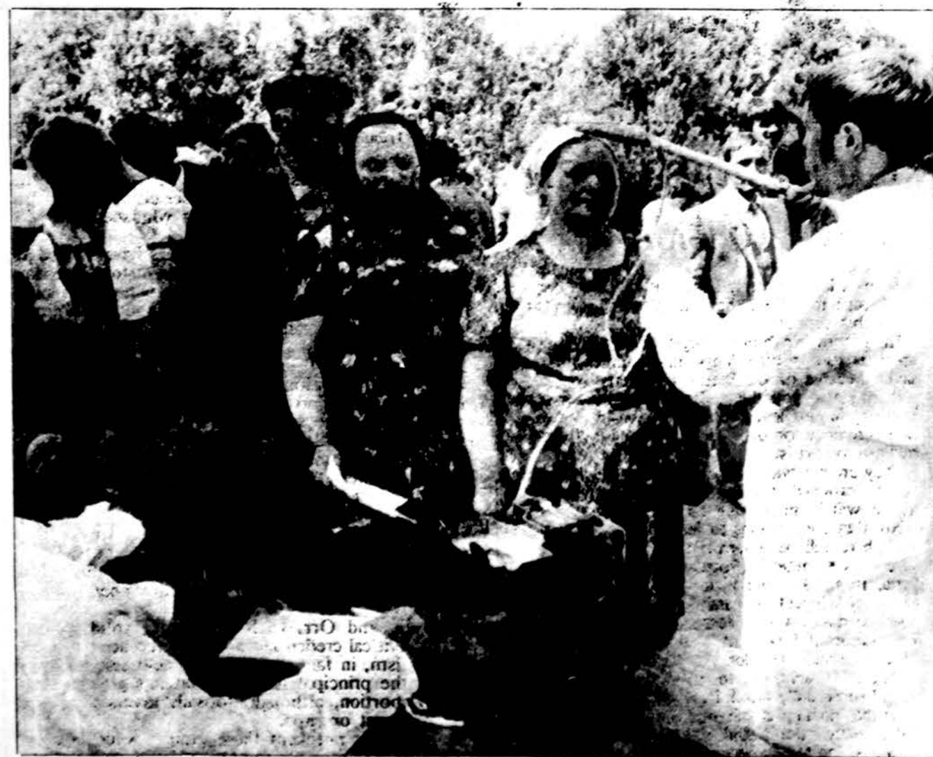
Iš Černobyl apylinkės evakuotieji tikrinami, kiek juos palietė radiacija.

— JT taupyti nemoka. Vien New Yorko centrinėje būstinė je samdo 7000 tarnautojų ir moka dideles algas. Numato- ma, kad JT spalio mėnesį išstiks krizė, neturės kuo tarnautojams mokėti.