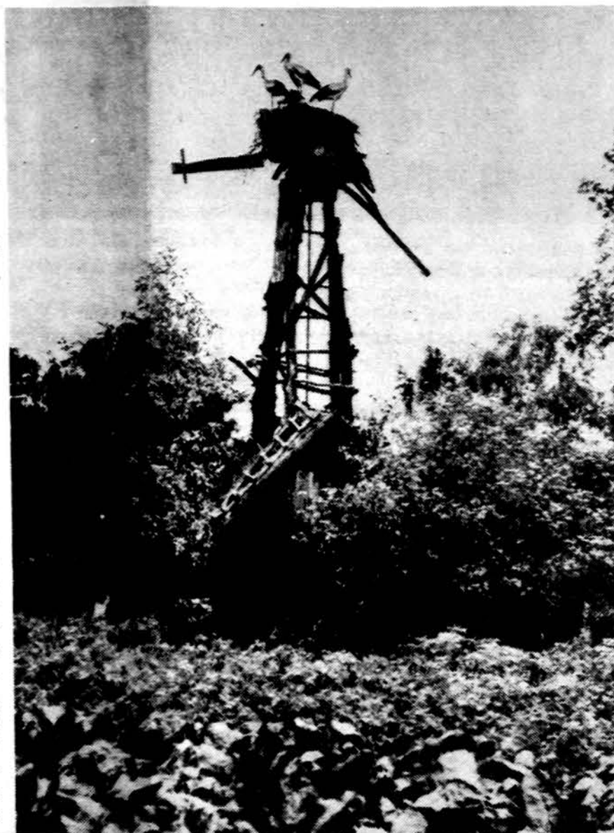
Lietuviški gandrai ant sugriuvusio vėjinio malūno Ignalinos apylin- kėje. (Iš A. Andrejevo ir E. Morkūno „Technikos paminklai Lietu- voje“, Vilnius, 1982.)