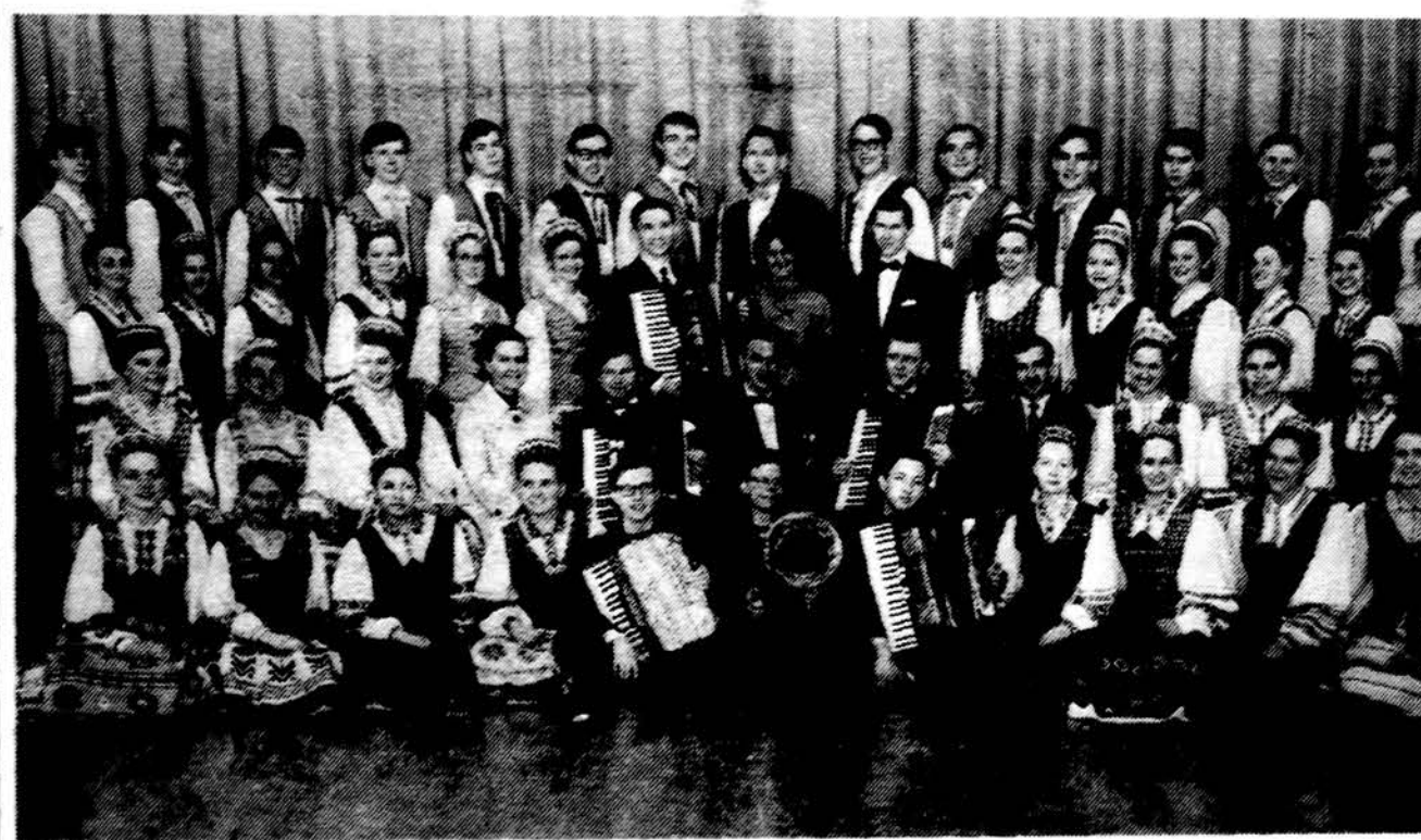
Grandinėle 1969 metais — ansamblis su vadovais, muzikais ir kt

— Ačiū už pokalbį. Sėkmingo šaskrydžio bei ilgų ateities dienų!