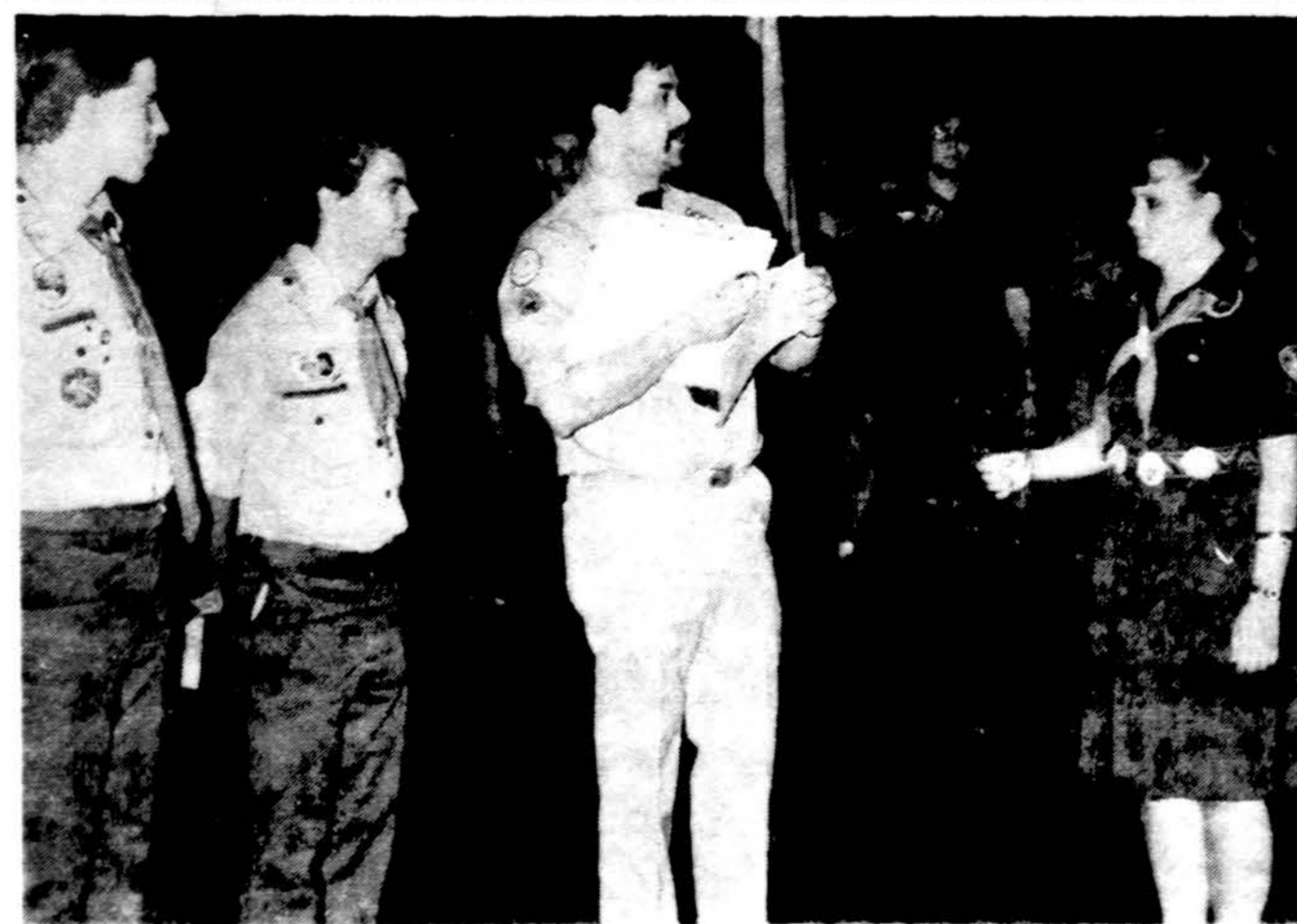
Lietuviškas skautiškas jaunimas Sv. Jurgio šventės sveigoje.