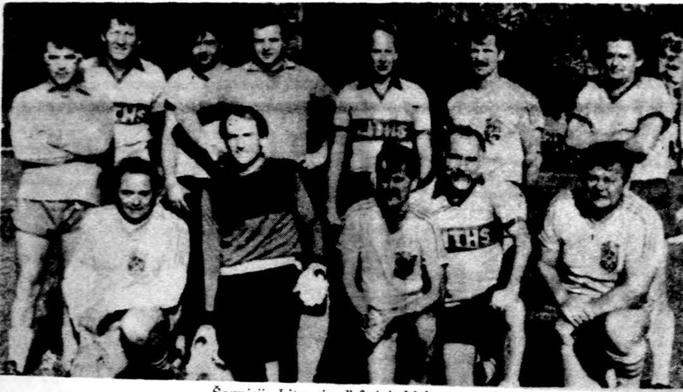
Saunieji „Lituanicos“ futbolo klubo veteranai.