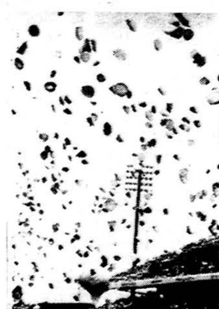
Po to bus nemažai vargo, iki visi suras savo kepurės. Jau tokia tradicija, kad jaunieji karininkai, baigę Karo laivyno akademiją Annapoly, MD, ceremonijoms pasibaigus, meta į aukštį kepurės. Šiemet baigė 1015 asmenų, tarp jų 64 moterys, 43 juodieji ir 49 azijiečiai.

Meksika. — JAV ambasadorius Meksikoje John Gavin paskelbė, jog jis gegužės mėn. pasitrauks iš diplomatinės tarnybos ir grįš į privatų sektorių. Jis užbaigia savo penkerių metų kadenciją. Pirmą kartą respublikonų vadai ragino amb. Gaviną grįžti į Kaliforniją kandidatuoti į senatoriaus vietą prieš demokratą sen. Alan Cranstoną, tačiau Gavinas atsakė, jis nenorįs tapti politiku, o turįs įvairių sumanymų biznio srityje.