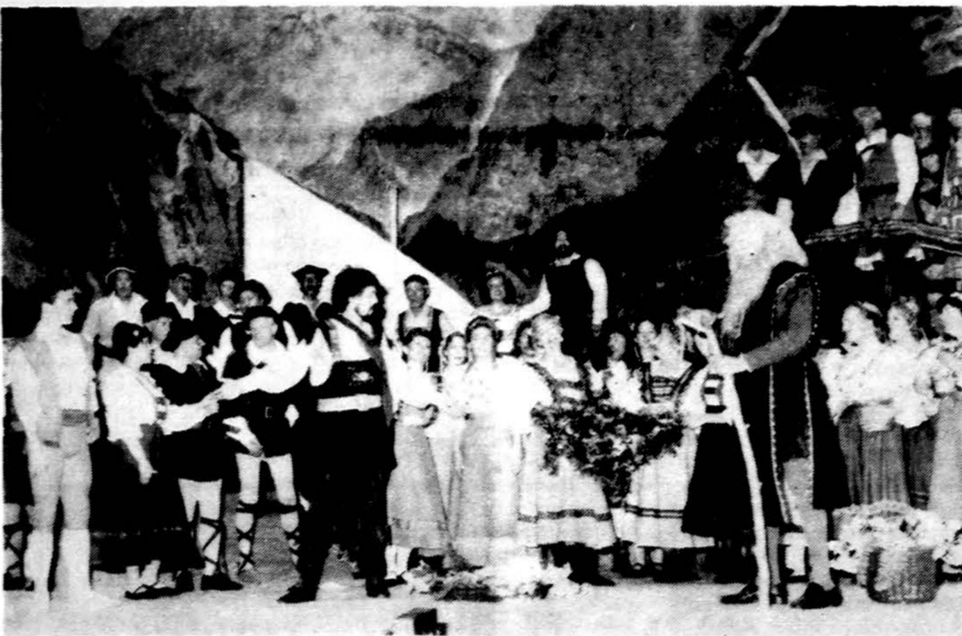
„Viliaus Telio“ operos scena birželio 15 d. pastatyme Morton salėje Cicero, Ill., 30-ties metų Lietuvių Operos gyvavimo sukaktį paminėti.