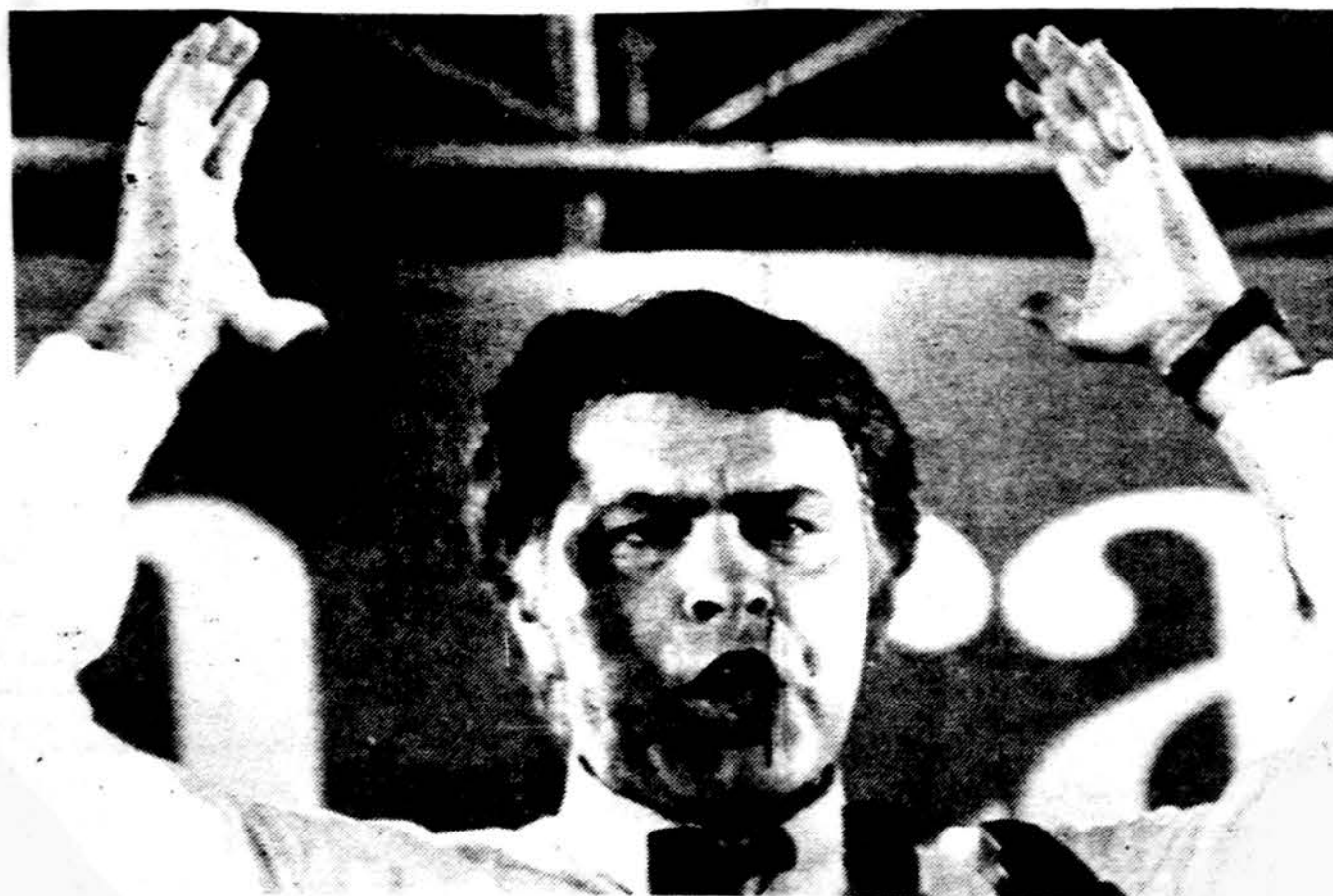
Ispanijos premjeras Felipe Ginzalez pradėjo rinkiminę kampaniją baskų provincijoje, kur jis turi daug priešų. Parlamento rinkimai bus ateinančių sekmadienį. Sakoma, kad baskų provincijoje Ispanijos socialistų partija gali pralaimėti 15 vietų.

— Amerikoje lankosi Urugvajaus prezidentas Julio Maria Sanguinetti. Tai pirmas šalies prezidento vizitas Amerikoje po 30 metų.