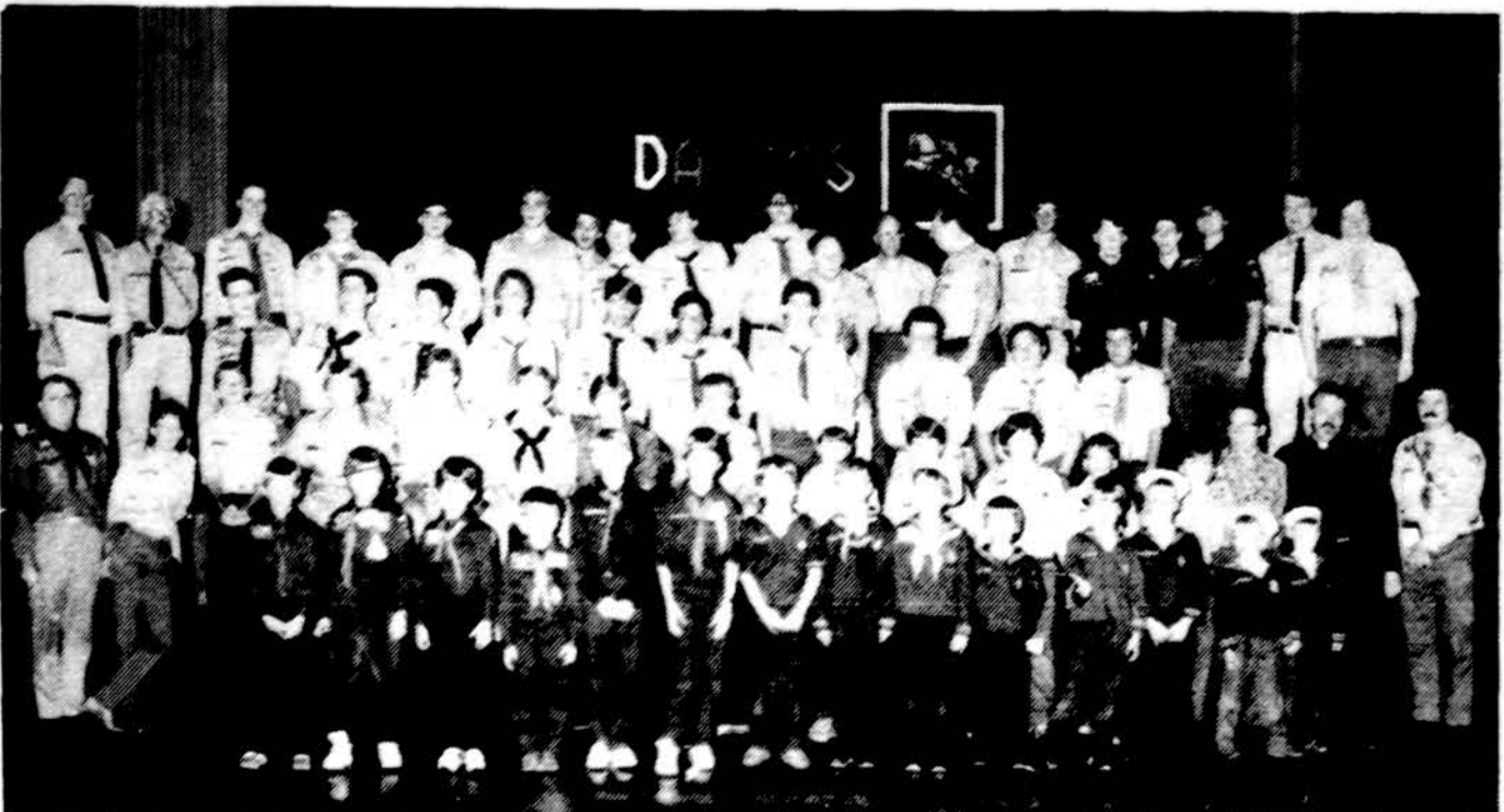
„Lituanicos“ tuntas Chicagos skautų ir skautėlių šv. Jurgio sueivijoje.