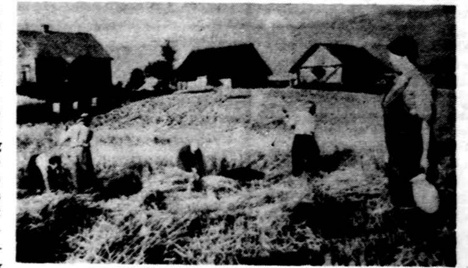
Tik prisiminimas liko lietuviškos sodybos. Dabar okupanto dvarai, o žmonės jų vergai.

Visi Clevelando Šv. Kazimiero lit. m-los mokiniai („Mūsų žingsniai“).