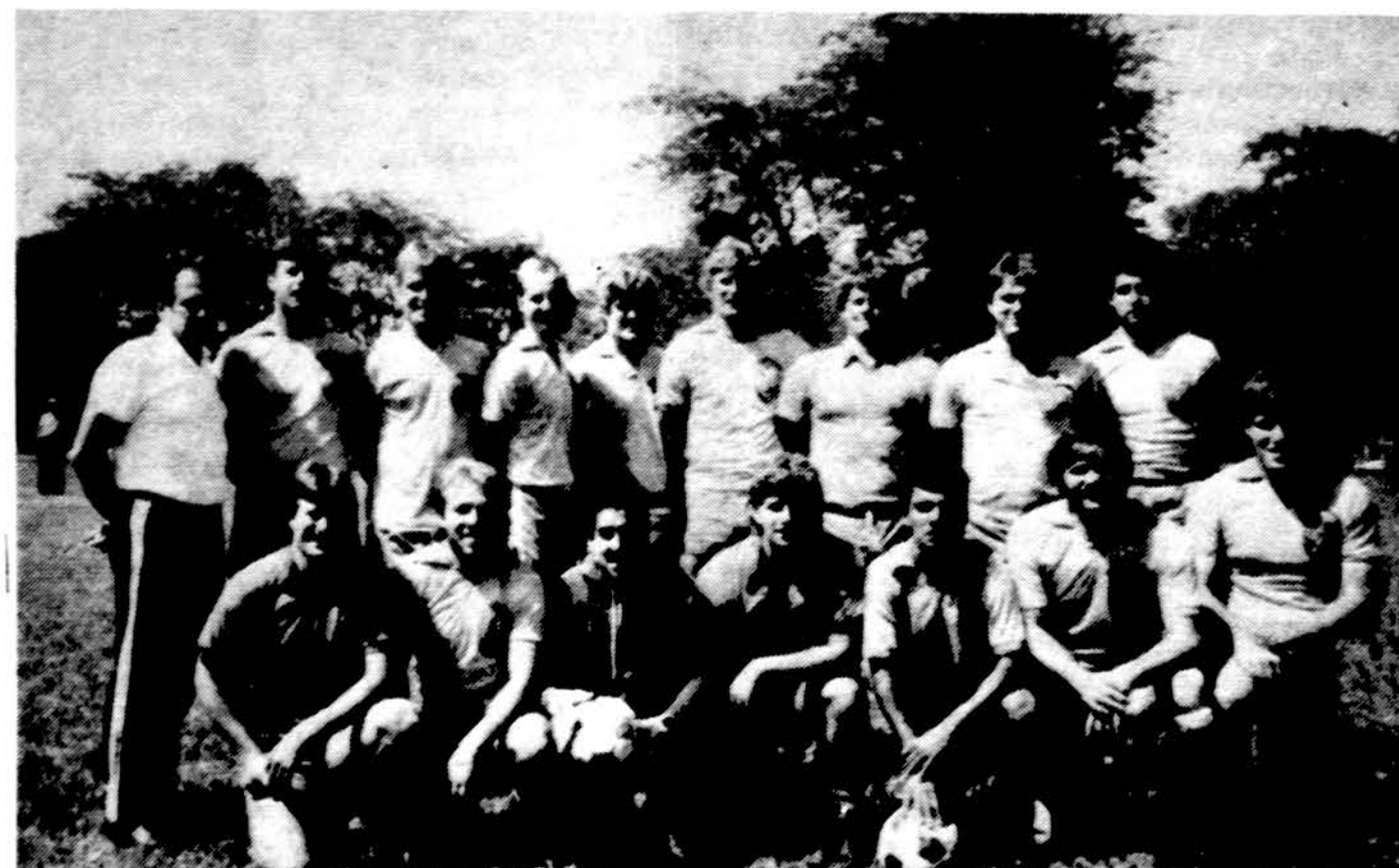
„Lituanicos“ futbolo klubo vyrų komanda

O ką turi „Lituanica“? „Lituanica“ turi visą komandą, kuri pasiryžus laimėti. Taip tvirtina komandos „coach“ Don. Ar pavyks pamatysime šį sekmadienį 3 val. po pietų Marquette Parko aikštėje. Rezervas žais 1 val. J.J.