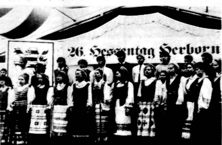
Kiekvieną pavasarį Vokietijoje pagausėja visokių švenčių ir iškilnių. Dažnai Vasario 16 gimnazijos mokiniai šokėjai, muzikantai ir choristai kviečiami įvairiose progose koncertuoti. Kasmet jie dalyvauja tradicinėse Heseno dienos, Gimnazijos choras dainuoja C. Sasnausko dainą „Kur bėga Šešupė“.