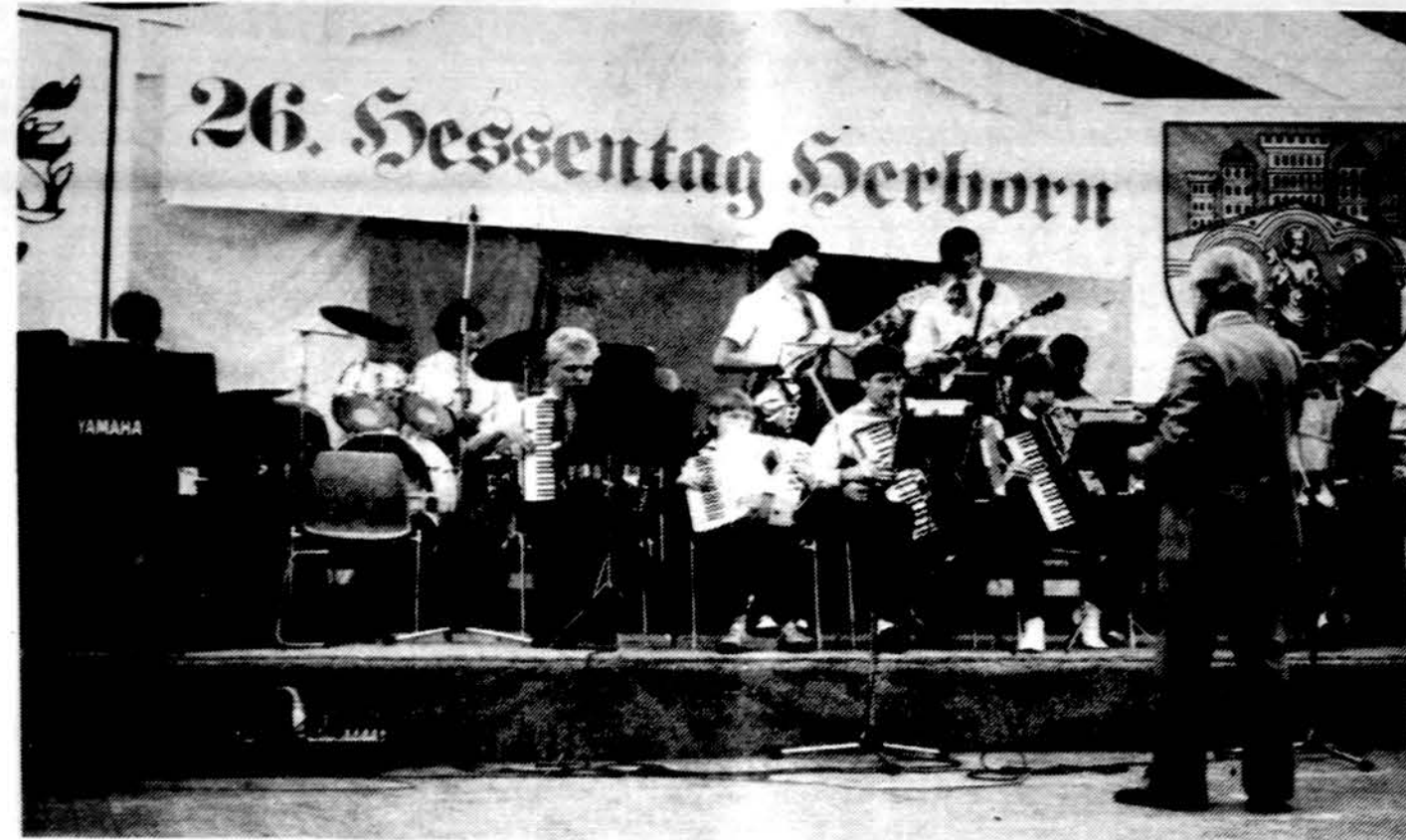
Vasario 16 gimnazijos muzikantai groja tradicinėse Heseno dienų iškilnėse Herborne.

x Wisc. Dells erdvus rasti- nis namas, 2 židiniai, didelis balkonas, gazu šildymas, didelis sklypas ant aukšto Wisc. upės kranto pušyne, lietuvių kolonijoj, geras žuvasimas ir grybavimas. Geros pirkimo sąlygos. Tel. 312-776-6379.