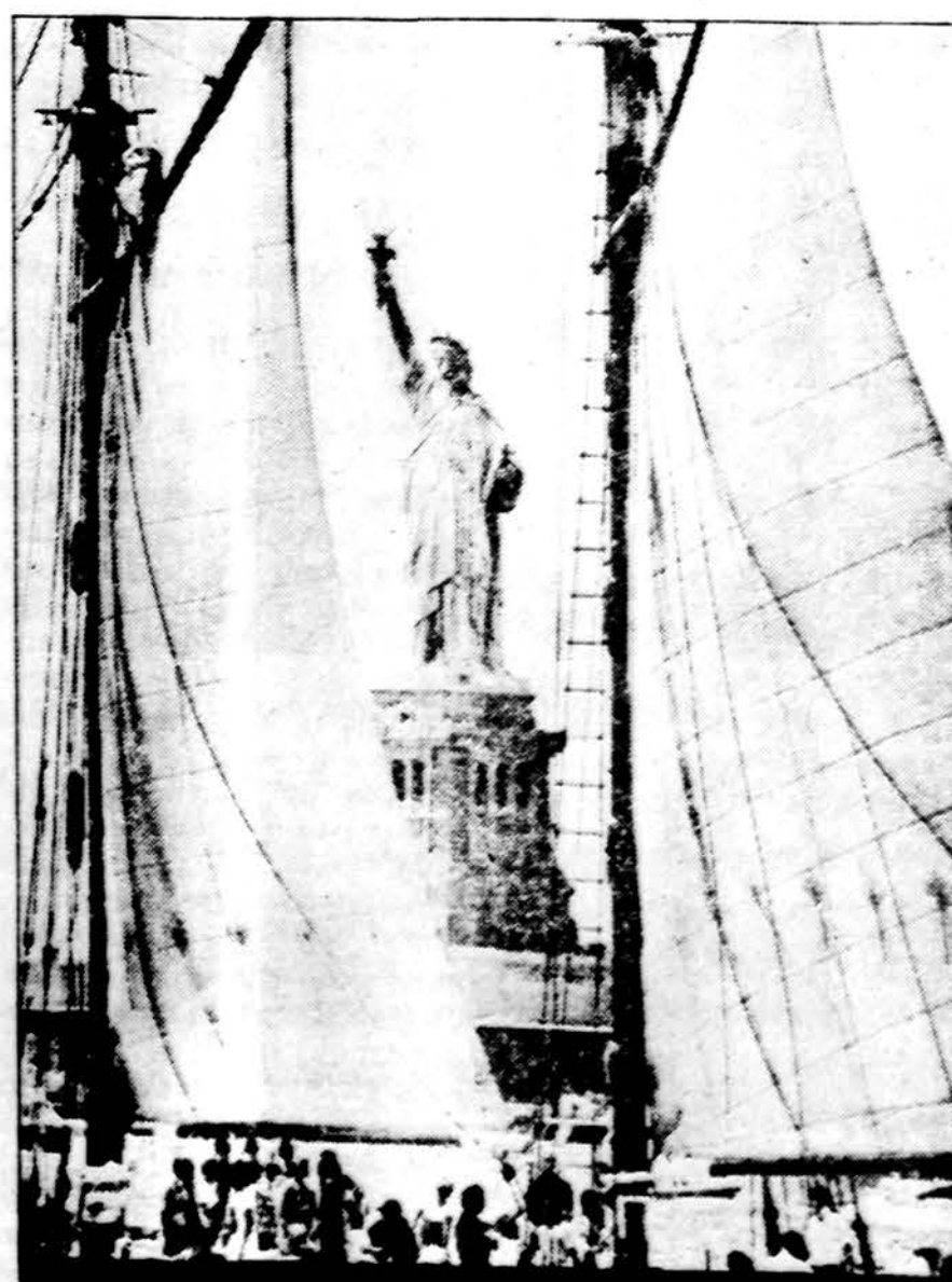
Po dvejų metų remonto iškilmingai atidaryta lankytojams Laisvės statula ir pro ją praplaukia būrinis laivas.

Toliau kolumnistas sako, kad Amerikos revoliucija visų pažadų, vilčių dar neišpildė, bet sovietų spalio revoliucija ne tik kad neišpildė, bet, priešingai, sudėtas viltis begėdiškai sugriovė.