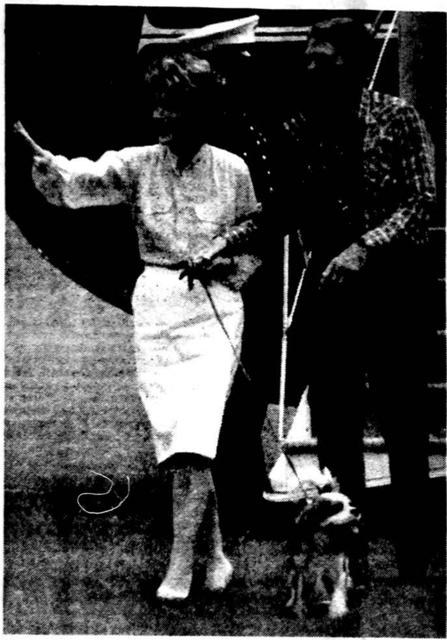
Prezidentas Ronald Reagan, ponis Nancy Reagan ir „Reksas“ grįž- ta į Baltuosius Rūmus iš savaitgalio poilsio Camp David, Md.