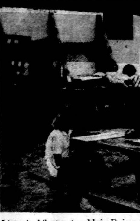
Lietuvių kilmės stovykloje Dainavoje džiaugiasi stovyklautojai, iš visos Amerikos suvažiuavę.

Minėtai trejopai gyvenime užsilaikymas pensininkas turi normalius vidurius. Reikia labai energingai veikti visiems su kietviduriu susiduriantiems — tiek jo artimiesiems, tiek ligoninėse ar prieglaudos personalui, o taip pat ir pačiam kietviduriui. Tai sunkus darbas, bet jis turi būti atliktas. Čia reikia sąžiningo ir neatlaidaus pagelbininko, idant kietviduris pensininkas pajęgtų savo kietus vidurius sunormuoti.