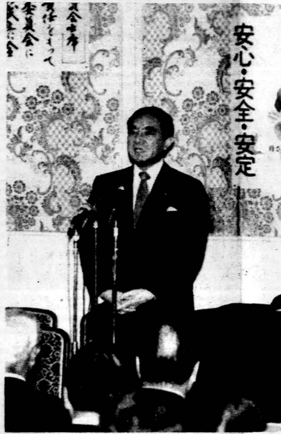
Japonijos premjeras Yasuhiro Nakasone, sustiprines valdančios liberalų demokratų partijos daugumą parlamente, kalba partijos vadų susirinkime. Partijos vadovybė nutarusi palikti Nakasone partijos pirmininku dar vieną kadenciją. Tuo pačiu jis liki ir premjeru.

— Kalifornijoje ir Aliaskoje sekmadienį buvo nedideli žemės drebėjimai.