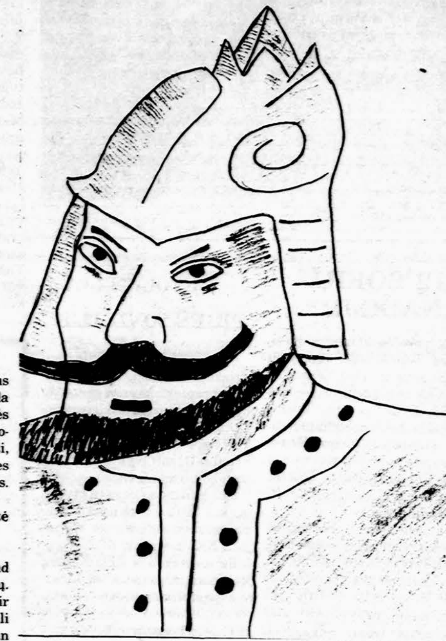
Didysis Lietuvos Kunigaikštis Gediminas

Išleistas Lietuvos Mokytojų Sąjungos Chicago skyriaus