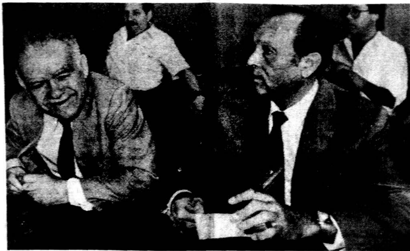
Izraelio užsienio reikalų ministeris Yitzhak Shamir (kairėje), Likudo partijos vadas, pastaruoju metu turi daug nemalonių. Jis turi perimti spalio mėn. Izraelio premjero vietą, tačiau dabartinis premjeras Peres sustiprino savo pozicijas. Peresui pavyko pašalinti iš kabineto savo kritiką Yitzhak Modai (dešinėje). Jis pašalintas iš finansų ministerio vietos, o vėliau — iš teisingumo ministerio pareigų.

— Pietų Afrikos policija suėmė nemažą skaičių juodu teroristų, rado didelius ginklus ir sprogmenų sandėlius netoli Durbanio miesto.