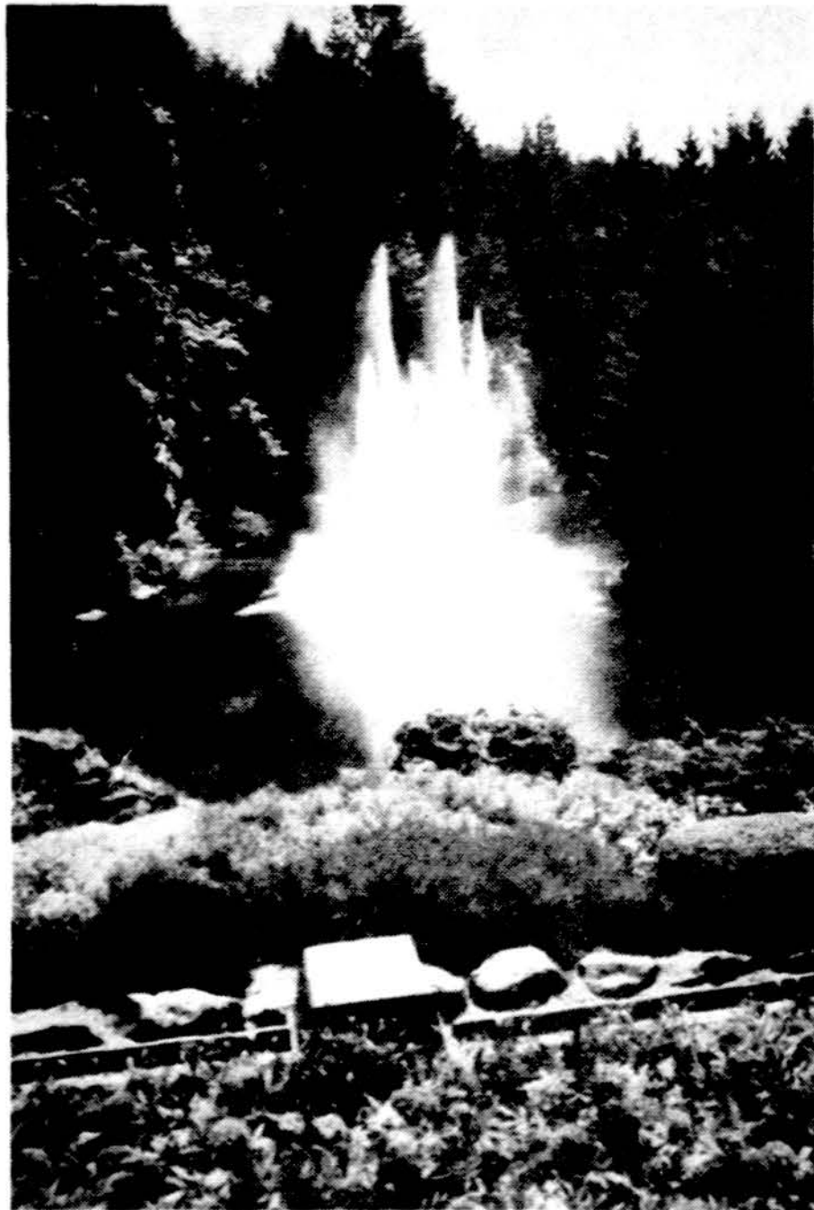
Vancouver saloje. Butchard sodų fontanas.

Amerikos pusėje yra tarptautinė muzikos stovykla. Užsukome. Medžių pavėsyje trys jaunuoliai, pasistatę gaidas, praktikuojasi trimitais ir dūdelėmis groti. Toliau orinio aikštė, vyksta turnyras. Užklausu praeinančios mergaitės, ar ši vakarą bus koncertas. Atsipašė, kad mano klausimo nesuprato, per gerai nemoka angliskai. Bet susišnekėjome. Ji atvykus iš Šveicarijos čia dviems savaitėms. Vieta patinka. Išsiaiškinom ir apie koncertus, kurie vyksta tik savaitgaliais. Nusipirkę „cokę“, važiuojame toliau. Kanados pusėje nieko ypatingo nebuvo. Sustojome apžiūrėti centrinį sodą. Gražu, bet neprilygsta Butchard sodui.