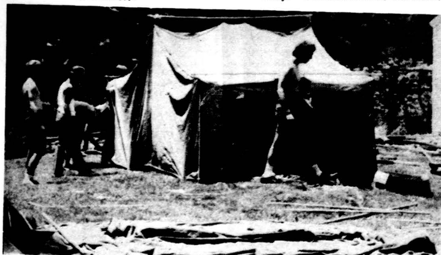
Stovykla prasideda, kai pastatoma pirmoji palapinė.

GYDYTOJAS IR CHIRURGAS 6745 West 63rd Street Val.: pirm., antr., ketv. ir penkt. 3-6; šeštadieniais pagal susitarimą