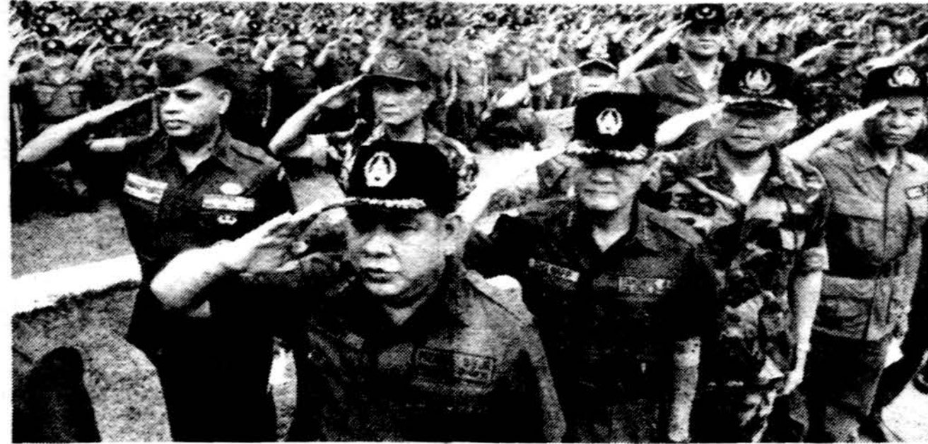
Visoje Filipinų kariuomenėje buvo prarastos ištikimybės priesaikos naujai vyriausybei ceremonijose. Nuotraukoje grupė aukštųjų karininkų, kairėje generolas Echeverria ir už jo — gen. Jose Zumel. Jie dalyvavo prieš tris savaites Marcos draugo Tolentino vadovaujamam perversmo bandyme. Dabar jie nutarė nutraukti ryšius su Marcos ir prisiekė ištikimam tarnauti prezidentei Aquino.

Managva. — Nikaragvos vyskupas bendru laišku kreipiasi į viso pasaulio vyskupų konferencijas, atkreipdamas dėmesį į pablogėjusią Bažnyčios padėtį Nikaragvoje. Laiške vyskupas kalba apie sustiprintus grasinimus ir smelptus prieš Bažnyčią iš valdžios pusės, apie naujas pastangas izoliuoti Bažnyčią nuo tautos ir nuo pasaulio, apie mėginimus sukurti vadinamą „liaudies Bažnyčią“, kuri būtų aklas valdžios įrankis. Esame nuolat puolami ir šmeižiami, panaudojant visas komunikacijos priemones, — rašo Nikaragvos vyskupas. Valstybinis saugumas stengiasi savo kontrolėn paimti kunigus ir veiklesnius pasauliečius. Per pastaruosius septynerius metus iš krašto buvo ištremti 17 kunigų ir dvi seserys vienuolės. Bažnyčiai nėra prieinamos televizijos programos. Buvo konfiskuota katalikų spaustuvių ir du katalikiški laikraščiai „Iglesia“ ir „La Prensa“. Nuo šių metų sausio pirmos dienos buvo uždaryta Nikaragvos katalikų radijo stotis. Nikaragvos Bažnyčiai, — baigia vyskupas, — reikia viso katalikų pasaulio maldos ir solidarumo.