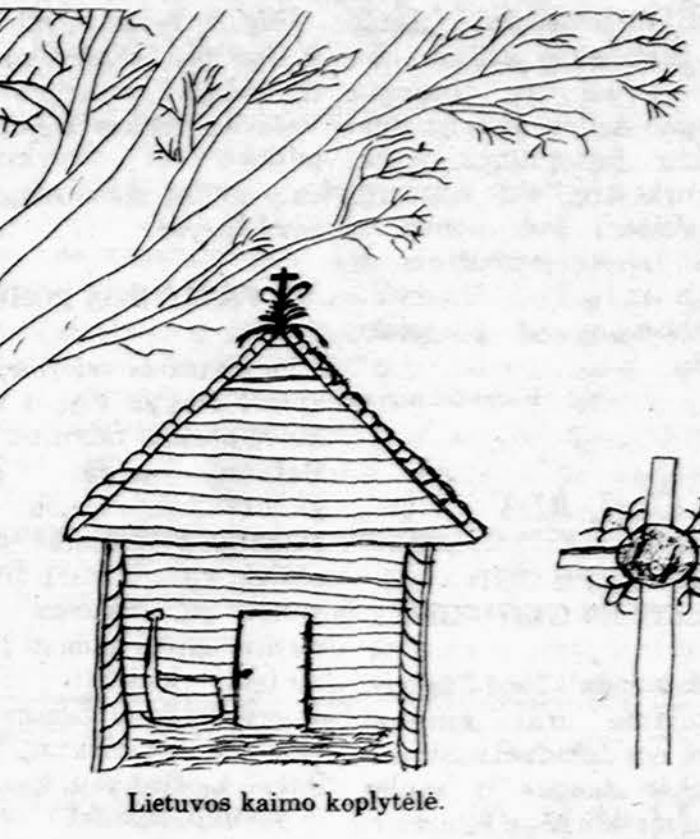
Lietuvos kaimo koplytelė.