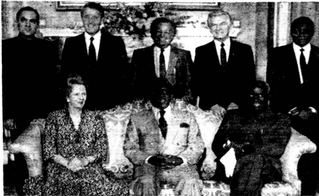
Londone baigėsi Britų Sandraugos vadų pasitarimai. Sėdi iš kairės: Britanijos premjerė Margaret Thatcher, Bahamos premjeras Sir Lynden Pindling, Zambijos prezidentas Kenneth Kaunda. Stovi: Indijos premjeras Rajiv Gandhi, Kanados premjeras Brian Mulroney, Sandraugos gen. sekretorius Shridath Ramphal, Australijos premjeras Bob Hawke ir Zimbabvės premjeras Robert Mugabe.

Spauda vadina šią prezidento iniciatyvą „žodžių karu“, nes biudžete buvo sumažintos lėšos sveikatos programoms, kurios atratina narkotikų naudotojus nuo šio pavojingo įpratimo. New Yorko narkotikų gydymo įstaigos perkrautos darbu, jose gydomi 3,808 žmonės, dar 1,079 laukia eilės, rašo „New York Times“.