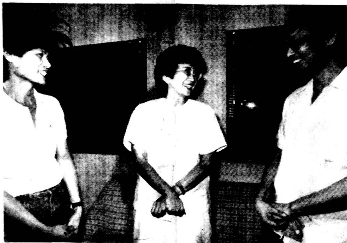
Filipinų prezidentė Corazon Aquino susitiko su dviem komunistų partijos vadais, kuriuos jos vyriausybė paleido iš kalėjimo. Dešinėje — Jose Maria Sison, laikomas Filipinų komunistų partijos steigėju. Kairėje Bernabe Buscayno, buvęs Naujosios Liaudies armijos viršininkas. Filipinuose prasidėjo derybos, kurių tikslas paskelbti karą paliaubas.

— Vakarų pramonės valstybės paskelbė, jog jos tarptautinei šalpai 1984 metais sudėjo 86 nuoš. visų JT lėšų, o komunistinis blokas davė tik 1 nuoš. lėšų. — Sovietų Sąjunga liepos mėn. emigracijos vizas suteikė 31 sovietų žydai. — JAV vyriausybė pasirašė tekstilės prekybos sutartį su Pietų Korėja. Jos tekstilės eksporto kvota padidinta tik 0.8 nuoš. per metus.