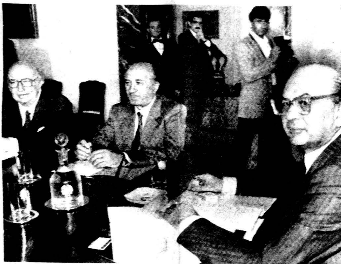
Italijos senatas patvirtino naują vyriausybę ir jos programą. Nuotraukos dešinėje — premieras Bettino Craxi. Kairėje — gynybos ministeris Giovanni Spadolini, viduryje — krikščionių demokratų partijos vadas Ciarraco De Mita.