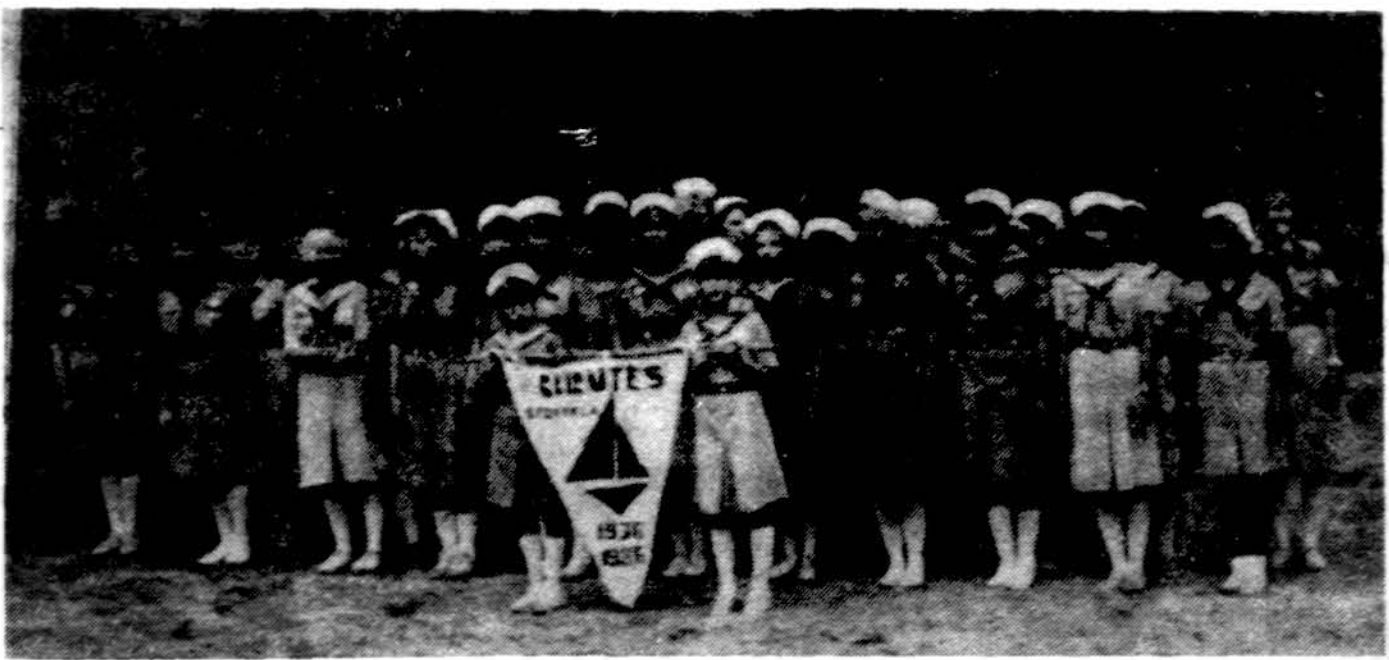
„Nerijos“ tunto jūrų skautės šių metų vasaros stovykloje.