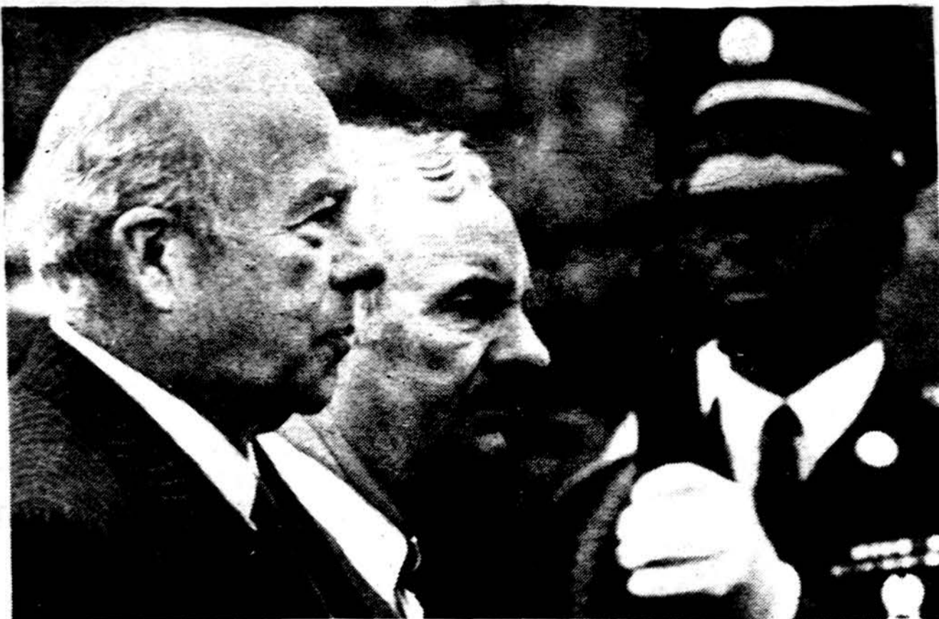
San Francisco mieste baigėsi ANZUS sutarties valstybių konferencija. Vietoj trijų valstybių dalyvavo tik dvi. Nuotraukoje valstybės sekretorius George P. Shultz ir Australijos užsienio reikalų ministeris William G. Hayden. Naujoji Zelandija laikoma iš sutarties pasitraukusia.