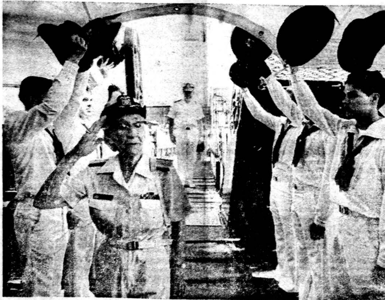
Bostono uoste stovinėjama karo laive „Constitution“ įvyko atsiveikimo ceremonijos, kuriose iš aktyvios tarnybos pasitraukė į pensiją admiralė Grace Hopper, 79 metų amžiaus, išbuvusi laivyno aktyvioje tarnyboje 43 metus.

Popiežius Jonas Paulius II laišku pasveikino apie dešimt tūkstančių prancūzų tikintųjų šiomis dienomis susirinkusių šventojo Grignon de Montfort aštuonioliktame amžiuje įkurtoje šventovėje. Prancūzai tikintieji, daugumoje jaunimas, čia kasmet susirenka dvasiniam atsinaujimui. Jiem pasiūstame laiške, Jonas Paulius II, pagirdamas šią iniciatyvą, pažymi, kad ypač dabartiniiais laikais yra svarbu nuolat atsinaujinti tikėjime, sustiprinti savo ryšius su Kristumi, apmąstyti krikščionių uždavinius šiuolaikiniame pasaulyje.