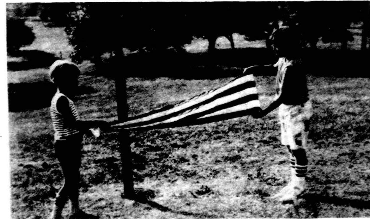
Po vėliavų nuleidimo tvarkingai sulankstoma vėliava.

Taigi ideali laisvė yra veržimasis į gėrį ir į šviesą. Laisvas žmogus yra tik tas, kuris yra ne tik fiziškai, bet ir moraliskai bei dvasiškai subrendęs, kuris sugeba save apvaldyti ir racionaliai pasireikšti. Laisvės dvasia yra nusiteikimas suprasti tiesą ir noras elgtis teisingai, supratimas kito žmogaus ir respek-