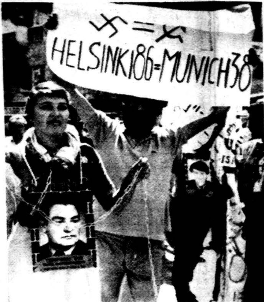
Jeruzalėje įvyko piktos buvusių sovietų žydų demonstracijos, protestuojančios prieš vyriausybės derybas su Sovietų Sąjunga. Susitikimas įvyko Helsinkyje, kur buvo pasitarimai apie konsularines sutartis pasirašymą. Buvęs politinis sovietų kalnys Ščaranski patarė vyriausybei reikalauti žydų emigracijos palengvinimo, prieš suteikiant sovietams bet kurias nuolaidas.

Islamabadas. — Pakistane toliau tęsiasi neramumai ir riaušės. Policijos dalinys Karachi mieste suėmė 60 pakistaniečių, kurie reikalavo paleisti iš kalėjimo suimtus opozicijos partijos vadovę Benazir Bhutto. Nuo praėjusio ketvirtadienio riaušės žuvo jau 9 žmonės. Minios žmonių puolė geležinkelio stotį, malūno įrengimus ir banko pastatą.