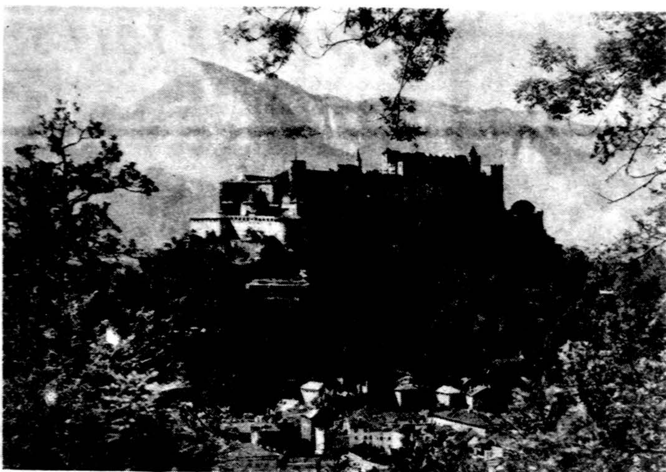
Salzburgas su išlikusia vidurinių amžių tvirtove ir tolimoj Untersbergu, dviejų kilometrų aukštieji Alpių kalnai.