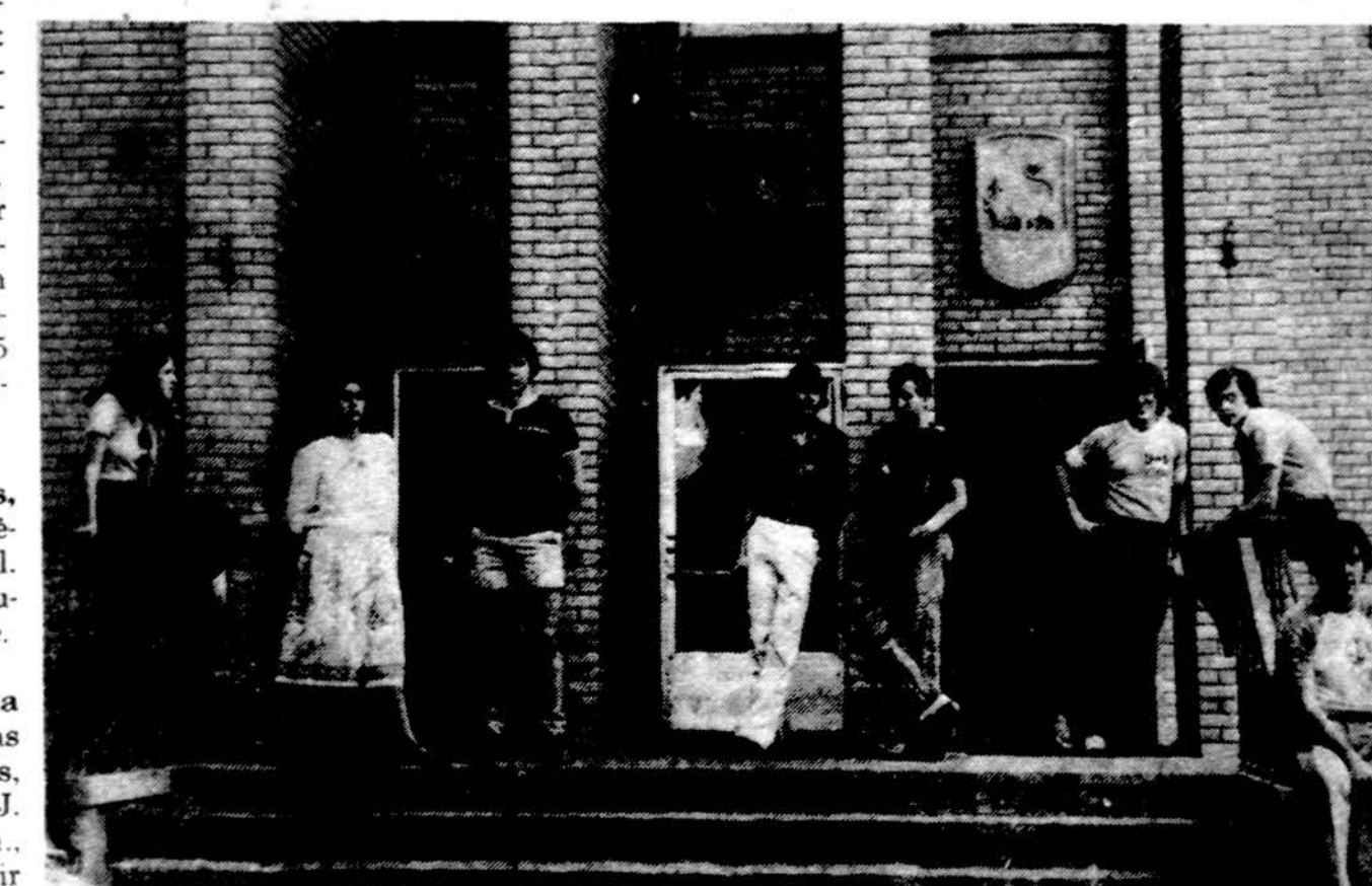
Studentų grupė prie Pedagoginio Lituaništinio instituto. Laukia mokslo pradžios.

Darbo val. nuo 9 iki 1 val. vak. Šeštad. 9 v. r. iki 1 val. d.