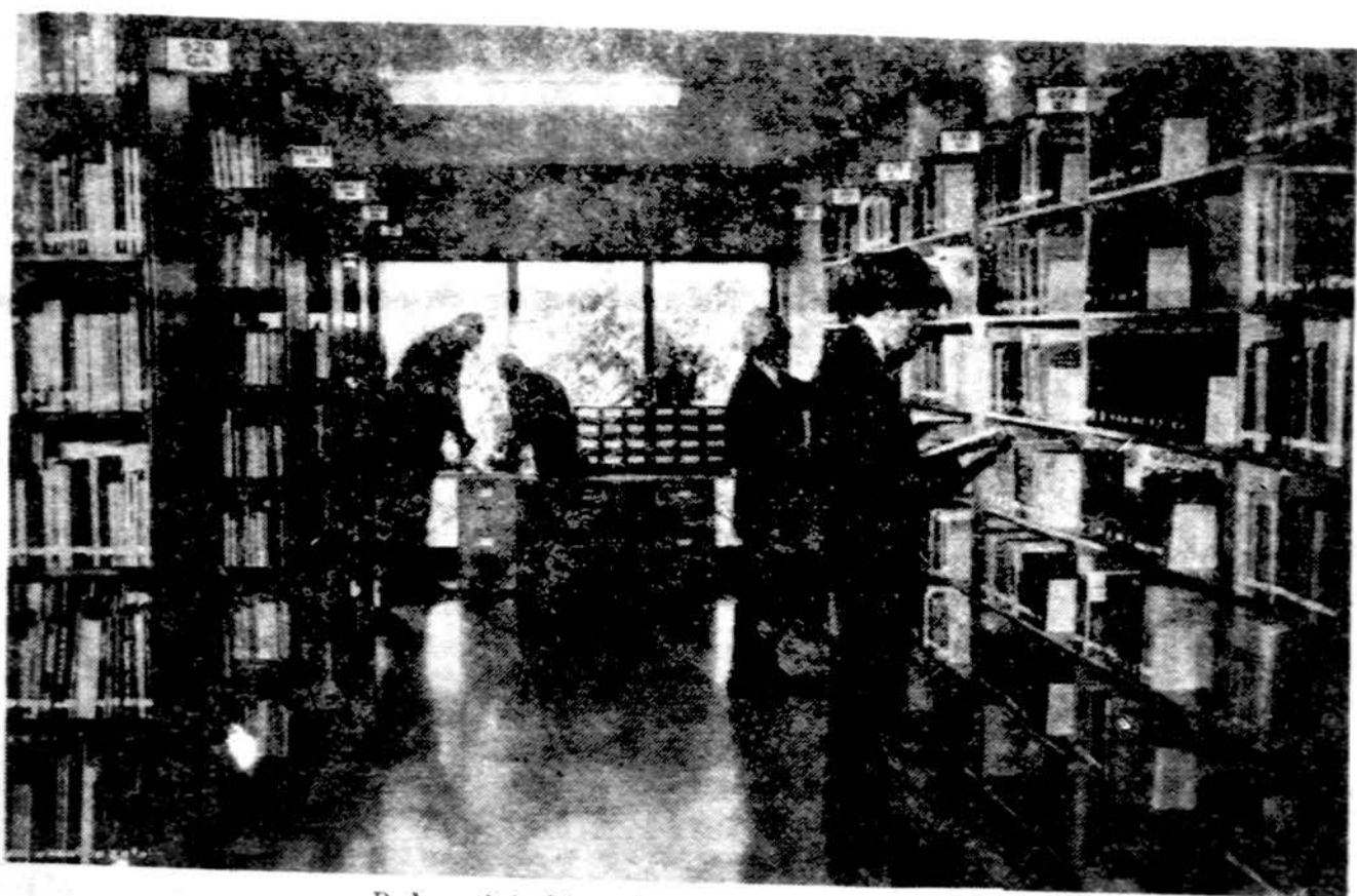
Pedagoginio Lituanistikos instituto biblioteka.