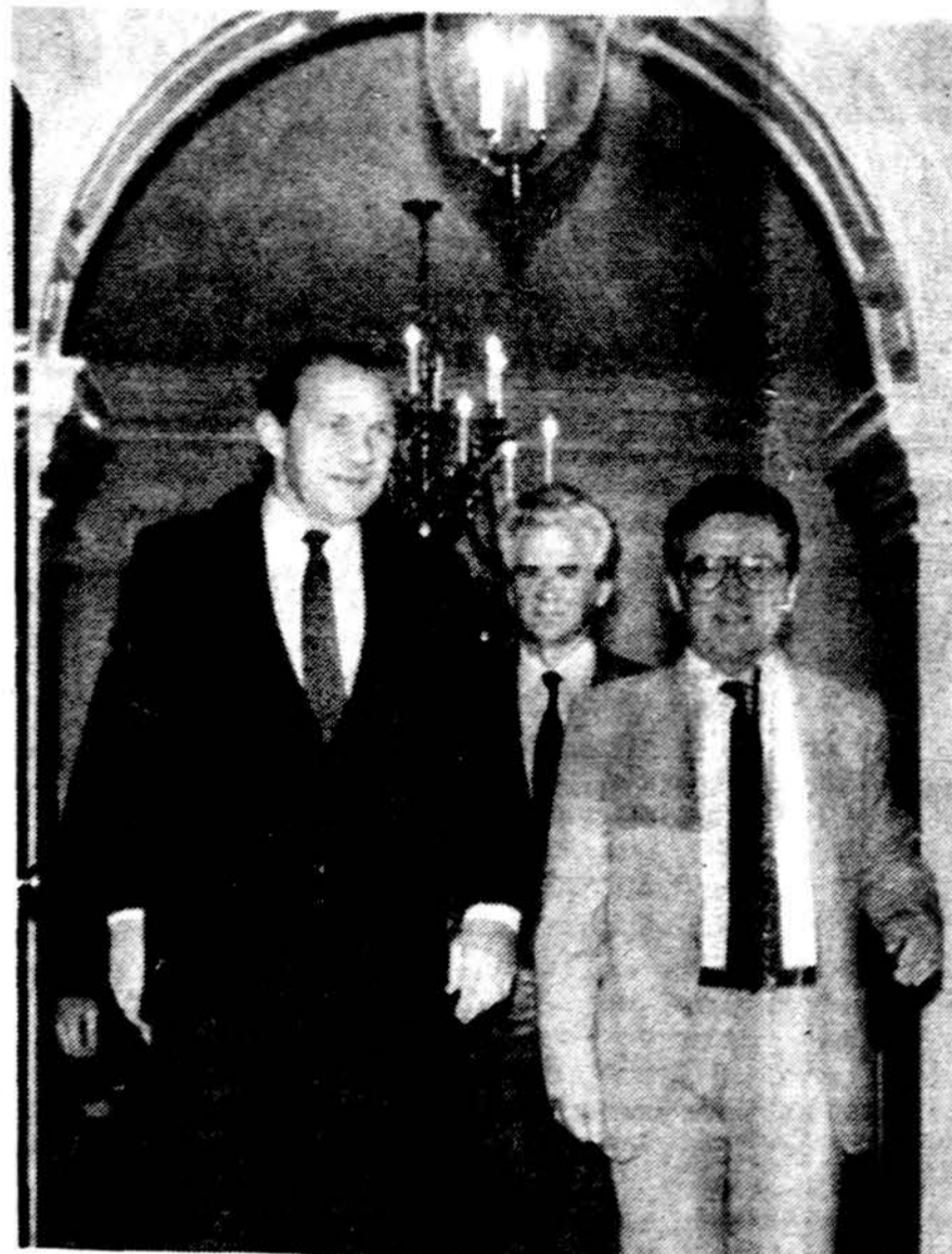
Valstybės sekretoriaus politinių reikalų pavaduotojas Michael H. Armacost, kairėje, ir Sovietų užsienio reikalų ministro pavaduotojas Anatoly L. Adamishin prieš pasitarimus Washingtono.